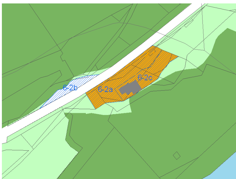
Slika 3: OPN s prikazom opredeljene pobude