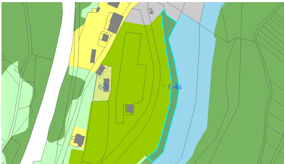
Slika 3: OPN s prikazom opredeljene pobude