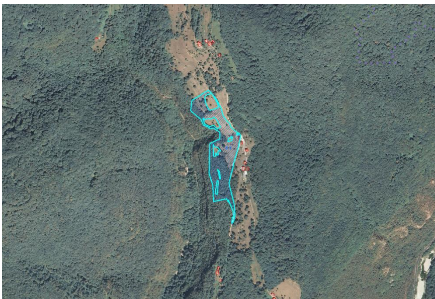
Slika 1: DOF (prikaz stanja) s prikazom prejete pobude