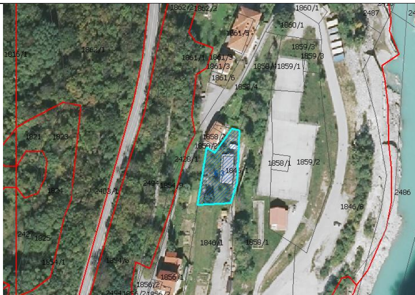
Slika 1: DOF (prikaz stanja) s prikazom prejete pobude