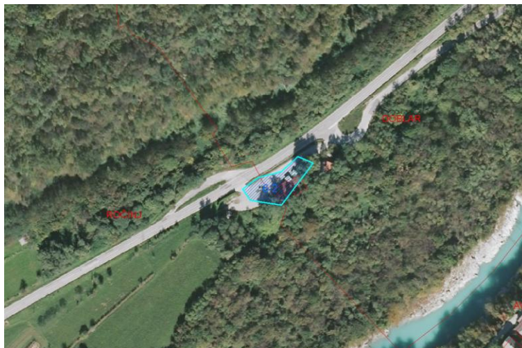
Slika 1: DOF (prikaz stanja) s prikazom prejete pobude