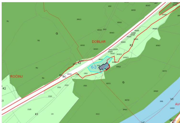
Slika 2: Veljavni plan (Odlok o občinskem prostorskem načrtu Občine Kanal ob Soči, december 2012) s prikazom poselitvenih enot (glej strokovne podlage – tematske analize, karta B) in dejansko rabo