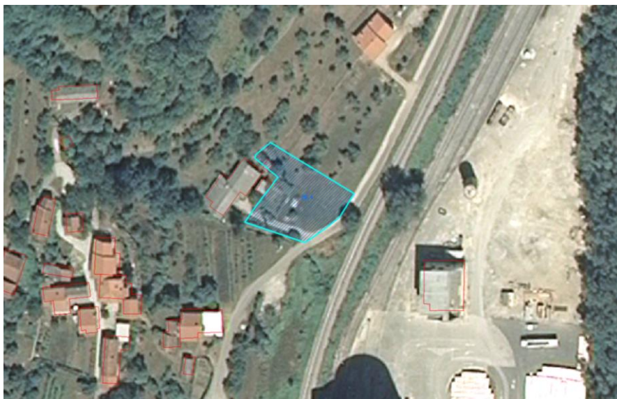
Slika 1: DOF (prikaz stanja) s prikazom prejete pobude