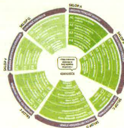
Shematska predstavitev ključnih korakov priprave Celostne prometne strategije

Pri izboru ukrepov imajo prednost mehki ukrepi , ki ne vključujejo gradnje, in trajnostni potovalni načini , ki nadomeščajo uporabo avtomobilov. Če slednji ne rešijo težav, pristopamo k reševanju infrastrukturnih rešitev .