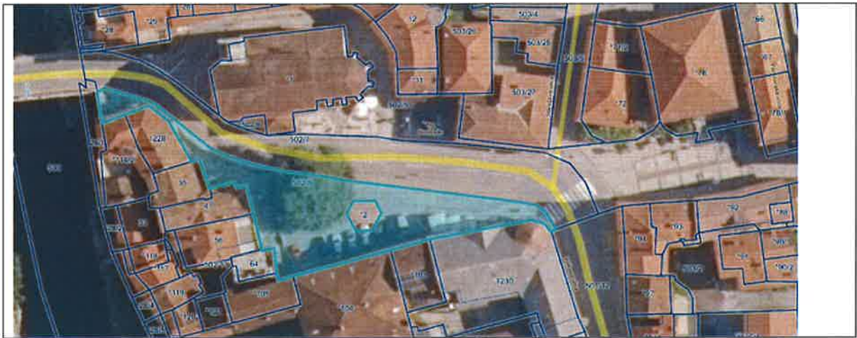
parcels 638 k.o. 2267 Bodrež