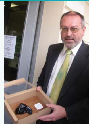
Meteorit - vaba za turiste

"Razpisni komisiji bom predlagal, naj se letos ta sredstva dodelijo tistim prosilcem, ki so tik pred odprtjem tovrstnih dejavnosti," pravi župan in hkrati napoveduje, da bo občinska komisija letos na terenu preverila, kako so zaživel projekti, ki jih je občina sofinancirala v preteklih letih, in ali so bila dodeljena sredstva porabljena v skladu z dogovorom.