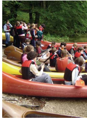
Iz Bohinja s kanuji