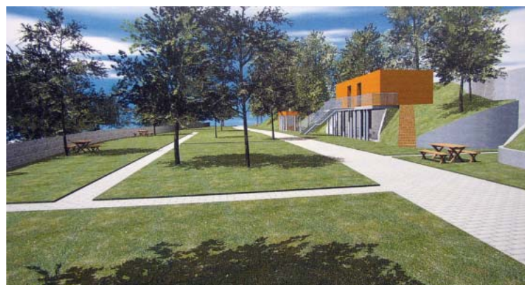
Neuresničena vizija kampa Korada - do kdaj?