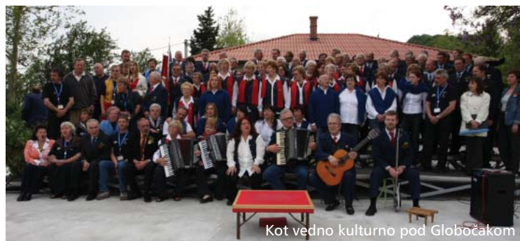
Kot vedno kulturno pod Globočakom