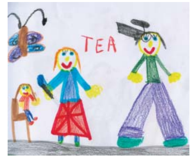
Tea, 5 let

MATIJA , Klobučče V našem kraju je lepo. Najraje se igram zunaj.