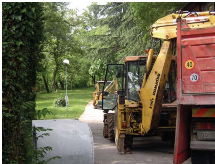
Stroji v edinem kanalskem kampu še brnijo

Kanal: Pobuda o mladinskem hotelu v mestnem jedru ni nikoli zaživela, čeprav je bilo v tej smeri kar nekaj poskusov. Ne samo da bi s tem pridobili prepotrebne postelje, ampak bi mladinski turizem pomenil tudi popestritev celotne turistične ponudbe. Navsezadnje je ob večjih športnih, kulturnih in drugih prireditvah potrebno iskati prenočišča za goste v Tolminu ali Novi Gorici.