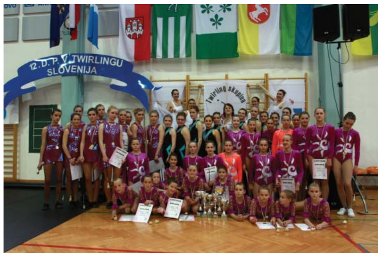
Zadovoljstvo končanih nastopih

pom, je svoje želje in občutke strnila takole: "To tekmovanje mi zelo veliko pomeni, ker se lahko pomerim z drugimi iz drugih klubov. Pričakujem pa največ – torej zlato medaljo" . Na koncu se je v paru