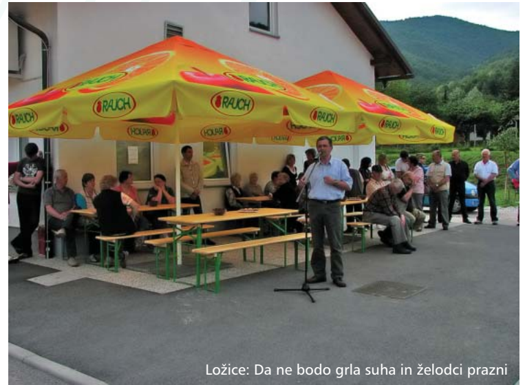
Ložice: Da ne bodo grla suha in želodci prazni

Občina Kanal ob Soči, Trg svobode 23, 5213 Kanal