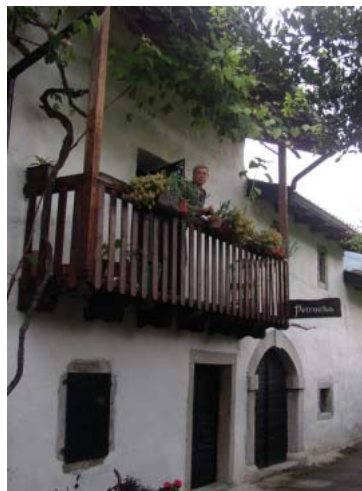
Petrucco "ugasnila" davkarinja?

Gorjanc: "Potrebno je plačati takse, davke, nato pa te oglobi še dohodnina in ti na koncu ne ostane nič, delo pa zahteva celega človeka."