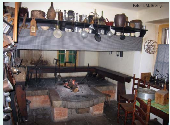
Kambreško: Ognjišče v Lukčevi hiši

Zanimiva bi bila tudi elektronska, virtualna oziroma spletna (internetna) zbirka, kjer bi lahko s pomočjo novih računalniških tehnologij pokazali našo dediščino vsemu svetu, menijo še v občini.