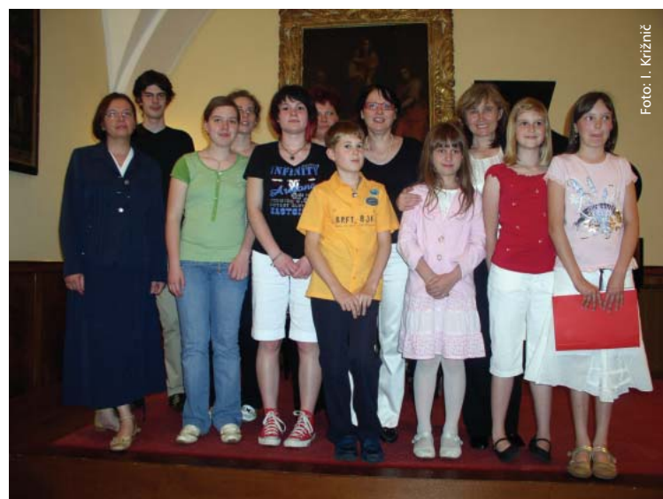
Učenci klavirja iz kanalske občine na zaključnem koncertu.