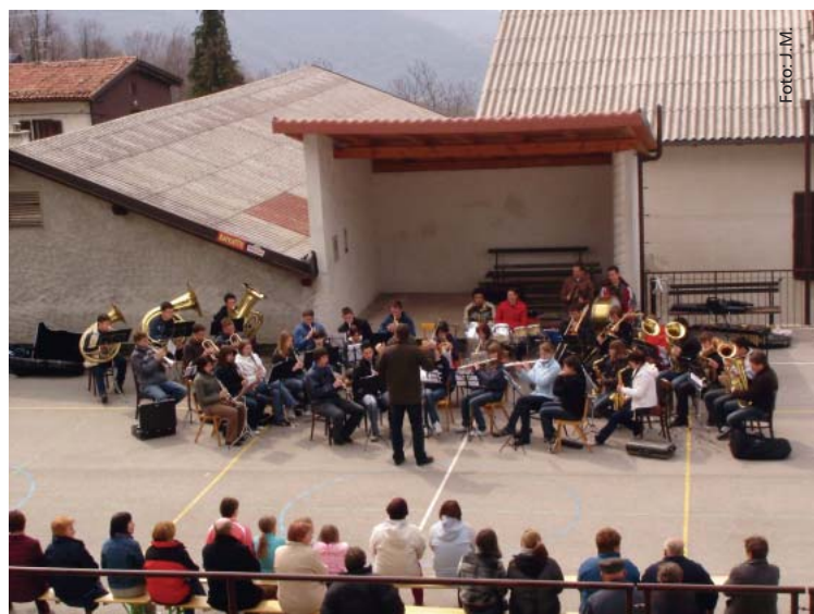
Pihalna godba iz Vrhpolja razveselila Ližane