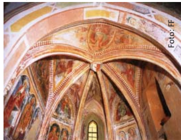
Prilesje: Rebrasti obok prezbitერიj

Pri poslikavah pa nikakor ne smemo pozabiti na znamenito freskantsko smer (suško-bodeško-prileška skupina), ki je ustvarila freske v Prilesju, njeno nasledstvo pa se kaže tudi v cerkvah na Goljevici (sv. Volbenk) in v Avčah (sv. Martin). Ostane nam še gotsko kiparstvo, ki je najbolj odmevno s krilnim oltarjem v Britofu. Lesene kipe pa lahko občudujemo v Nadavču (sv. Marija Snežna; tudi gotska arhitektura) in v Krstenici.