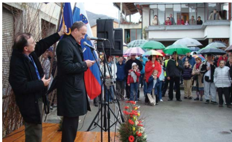
Okoljski minister Janez Podobnik na prireditvi v Avčah