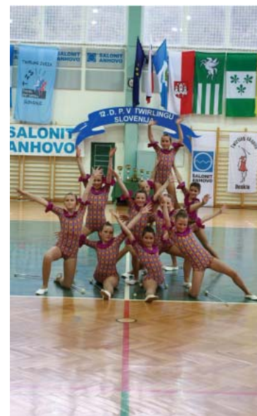
Dekleta v tekmovalnem elementu

Tako bolje razvijejo svoje telo, delajo več na gimnastiki in nastopu, tako da opažamo res velik napre-