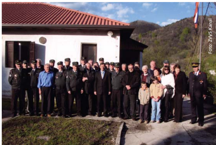
Kanalski veterani čakajo odgovor o prodaji stražnice