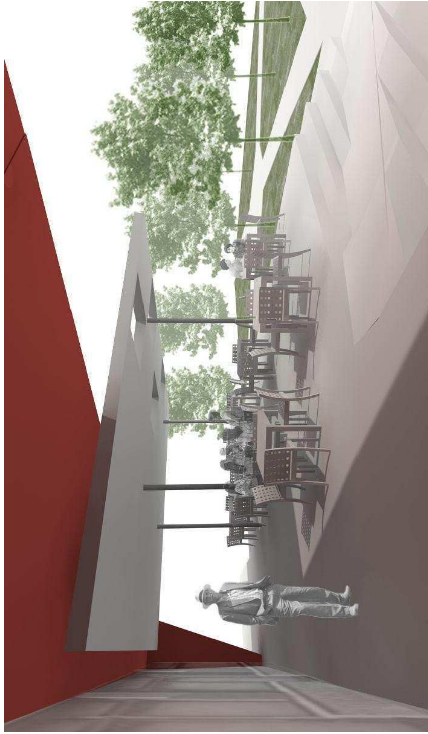
POGLED NA 2. FAZO UREDITIVNE TERASE IZPRED VHODA V KULTURNI DOM