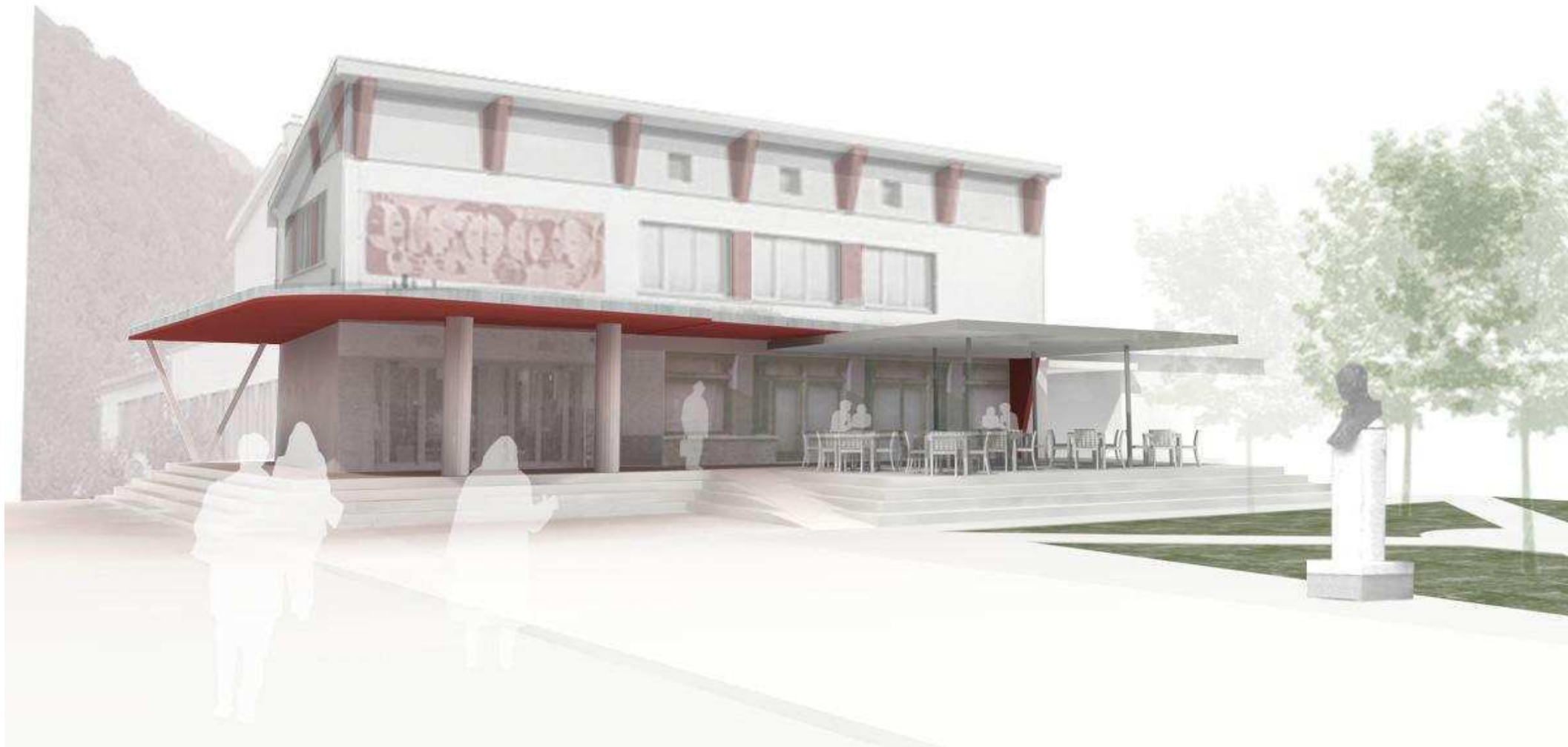
POGLED NA 2. FAZO UREDITVE TERASE KULTURNEGA DOMA Z MANJŠIM IN LAŽJIM NADSTREŠKOM