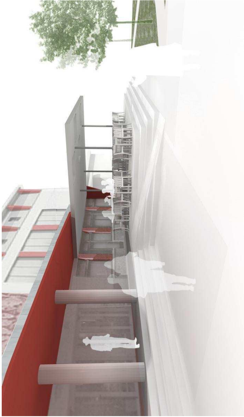
POGLED NA 2. FAZO UREDITIVNE TERASE IZ TRGA PRED KULTURNIM DOMOM