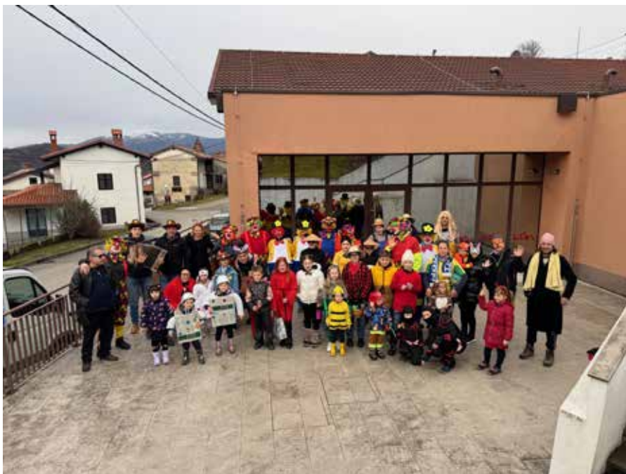
Otroško pustovanje v Ligu.

Tudi letošnje pustovanje se je izkazalo kot dogodek, ki razveseli tako domačine, ki »maškare« veselo sprejmejo v svoje domove in jih pogostijo, kot tudi same »maškare«, saj se z leti število udeležencev pustovanja povečuje.