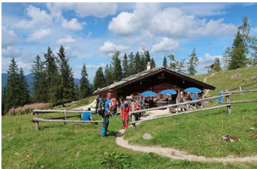
Planina z okrepčevalnico.

Tempo hoje je bil drugi dan nekoliko strožji, saj se je bilo treba pravočasno