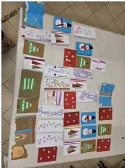
Novoletne voščilnice, izdelane na delavnicah v Levpi