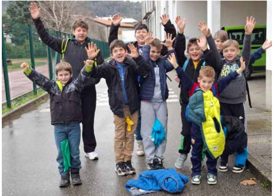
Ekipa OŠ Kanal.

F-15 let 2. mesto Lev Bavdaž Velušček, OŠ Deskle, in 3. mesto Rajmond Kofol, OŠ Kanal.