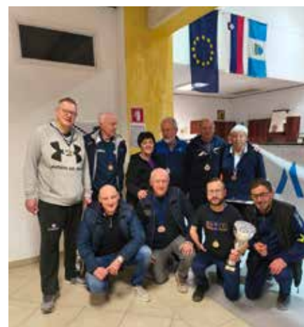
Balinarski klub Kanal.