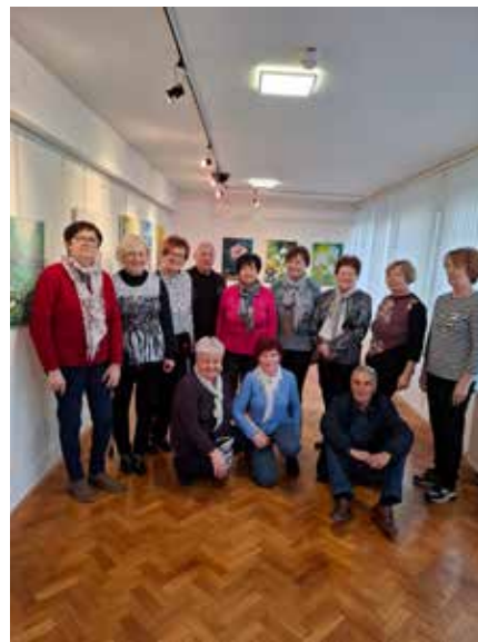
Likovna skupina Svetloba Deskle na odprtju razstave.

Ker si v teh težkih časih zaslužimo veliko miru in sprostitve, se slikarji z veliko mero vztrajnosti, potrpežljivosti in iznajdljivosti ter domišljije spuščajo na prazna polja slikarskih pleten in jih tako oživijo.