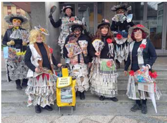
Časopisne dame pred kulturnim domom v Desklah.

Pustno veselje so zaključile na pustni torek, ko so v Desklah najprej obiskale lokale in trgovine ter se odpeljale še v Kanal. Posebno lepo so jih sprejeli na občini, kjer so se še posebno razveselili glasbene spremljave in svežih občinskih novic.