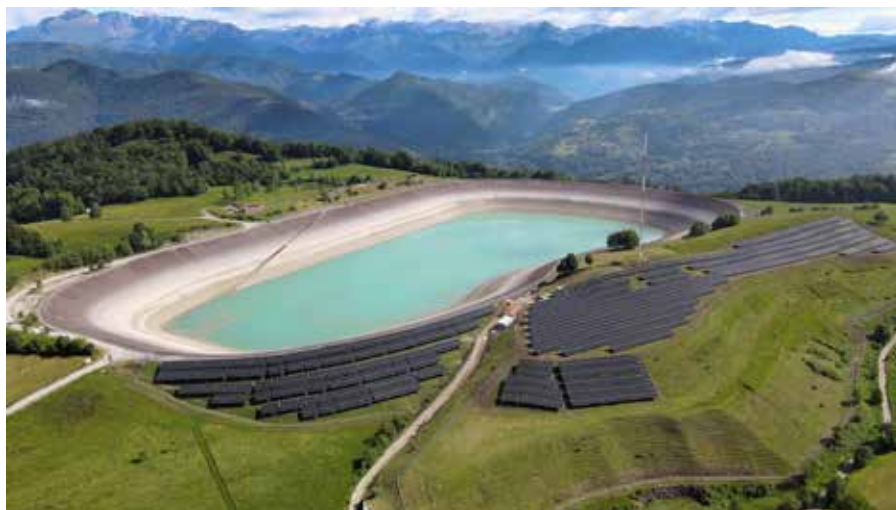
Prva faza sončnih elektrarn na Kanalskem Vrh.

Družba Soške elektrarne pa na območju Občine Kanal izvaja še en velik elektroenergetski projekt, sredi februarja 2025 so začeli prenovo 110-kilovoltnega stikališča pri HE Doblar, v okviru katerega