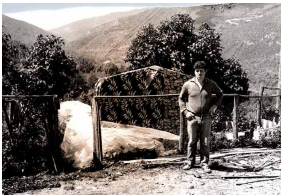
Zasilni šotor na Spodnjem Nekovem

Potres leta 1976 je pomembno zaznamoval nadaljnji razvoj prizadetih območij. Poleg neposredne škode je vplival tudi na kasnejše načrtovanje prostora, način gradnje in organizacijo pomoči ob na-