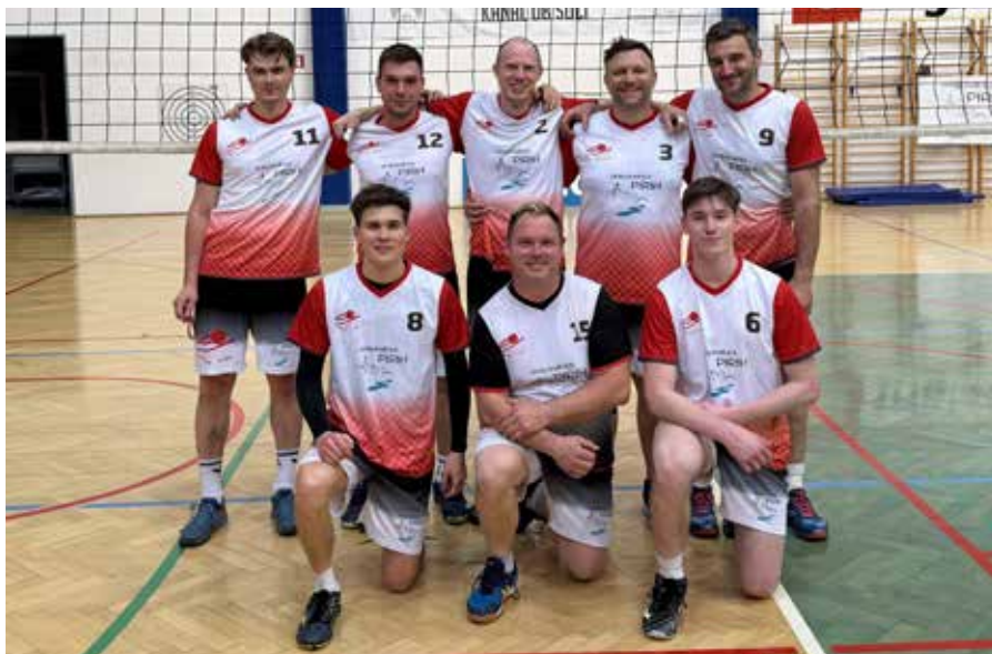
Domača ekipa ŠK Vienpi.