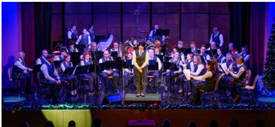
Tradicionalni, božično-novoletni koncert v KD Deskle.

Ob koncu decembra pa smo zopet stopili pred domače občinstvo, saj smo v Kulturnem domu Deskle izvedli naš že tradicionalni božično-novoletni koncert. Glasbeni program smo uvedli s še nekoliko zasanjano suito Planeti. Že po prvih uvodnih minutah pa smo poslu-