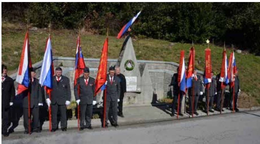
Polaganje venca pri spomeniku ustreljenim talcem v Desklah.