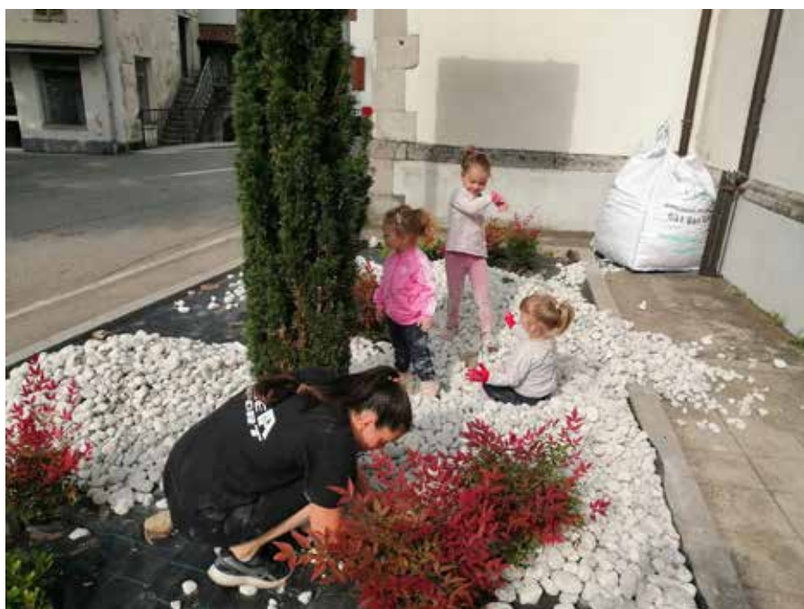
Urejanje gredice pri cerkvi v Kanalu.

Na Kanalskem Vrhu so domačini izrazili željo po ureditvi makadamske vaške poti ter jo sami na novo zabetonirali, enako lovilce meteorne vode. Največji varnostno higienski posek dreves je bil izveden v Morskem, kjer so uredili pešpoti ter avtobusni postaji pod vasjo, domačini mladinci so pridno uredili kuhinjo v večnamenskem prostoru športnega parka, v fitness prostorih so zamenjana okna, klime ... Čolnica je ravno tako prispevala prostovoljno delo pri ureditvi makadamskih vaških cest, želijo pa si tudi urejen vhod v naselje in varovalno ograjo, a to žal presega pristojnosti KS.