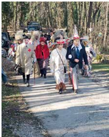
Liški pustje med obhodom po vaseh Kanalskega Kolvrata.

Liški pustje so tudi letos preživeli precej naporno pustno obdobje. Na pustno nedeljo, 15. februarja, so tradicionalno obiskali vasi pod Kanalskim Kolvratom in tako znova prikazali živo kulturno dediščino našega kraja, pred in po tem pa so se udeležili več povork in karnevalov v Sloveniji in zamejstvu.