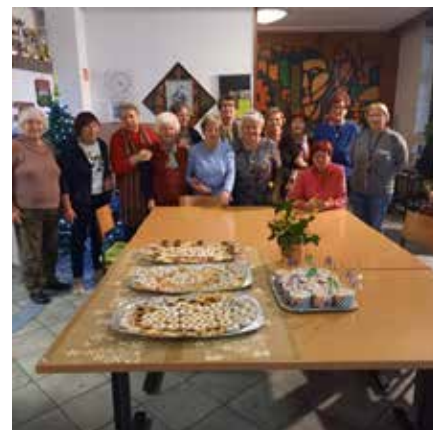
Novoletna peka peciva v Medgeneracijskem centru Pri Tinci.

Na zadnji dan marca smo se z vlakom zapeljali v Novo Gorico in si na železniški postaji ogledali muzejsko zbirko Kolodvor, ki je del zbirke Muzeji na meji in prikazuje življenje na nekdanji slovensko italijanski meji na območju Gorice od konca druge svetovne vojne.