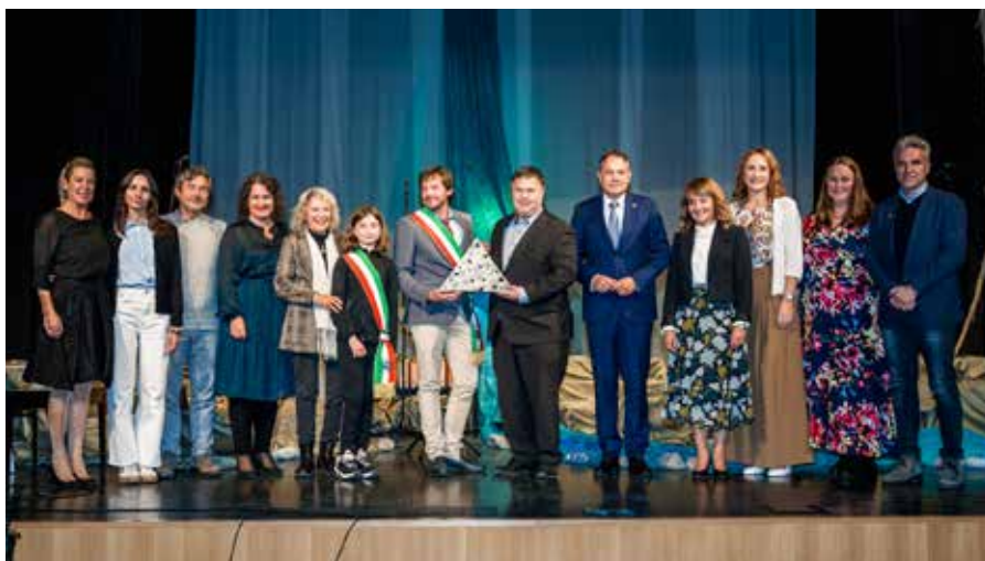
Proslava ob dnevu Soče.

Pripravili so promocijski letak Dobrodošli v Desklah in okolici ter maketo domačega kraja, skozi katerega se vije Soča, spoznavali so kraje ob Soči od izvira do izliva, razmišljali o zgodovini domačega kraja, fotografirali so reko in o njej prepevali, ustvarjali iz naplavin, oblikovali različne družabne igre, risali na kamne, ustvarjali soške postrvi iz naravnih materialov in razmišljali o tem, kaj jim pomeni reka Soča. Šepetanje Soče so ujeli v rime in svoje mojstrovine predstavili v zborniku literarnih prispevkov. V njem so tudi prispevki najstarejših učencev, ki