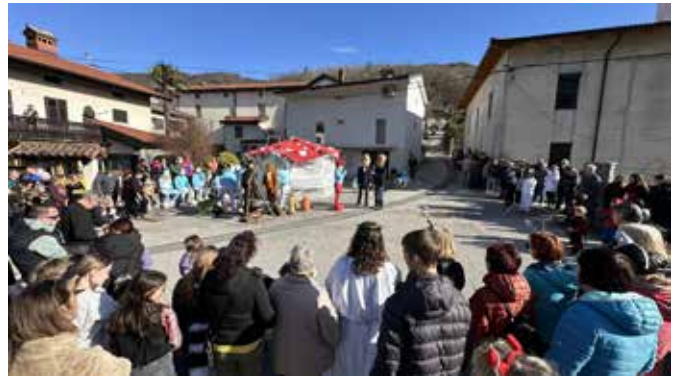
V Morskem so vas v pustnem času zasedli smrkci z idejami za izboljšave.