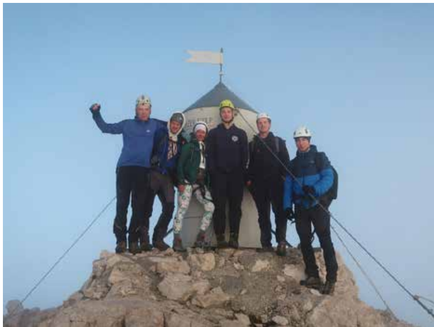
Letošnji udeleženci pohoda iz Ročinja do Triglava na cilju.