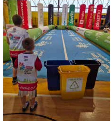
Štafeta v sklopu športnih iger mladih v Tolminu.