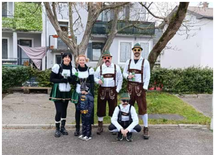
Pustarji v Desklah. Foto: Anja