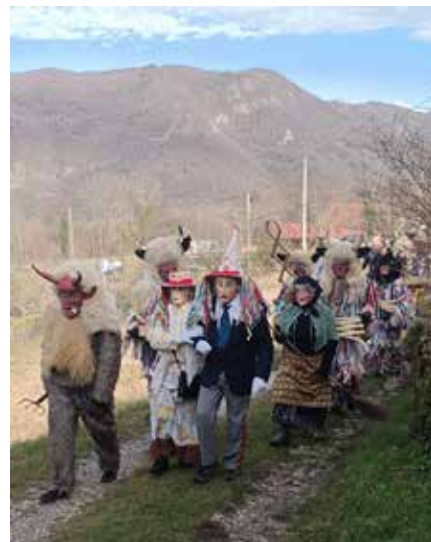
Liški pustje med obhodom po vaseh Kanalskega Kolvrata.

Pred tem je že decembra skupina parkeljnov, ki deluje pri Etnološkem društvu Liški pustje, nastopila na miklavževanju v Kanalu in ParkeljFestu na Vrhniki.