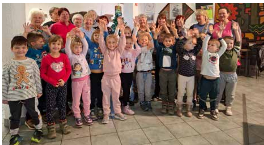
Obisk vrtca v Medgeneracijskem centru Pri Tinci.

Občnemu zboru sta sledila pogostitev in druženje v prijetni družbi.