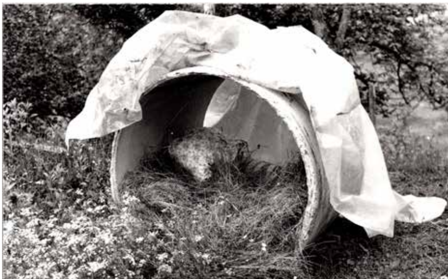
Zasilno bivališče na Kambreškem

Bil je lep, miren majski večer. Počasi smo se spravljali k počitku. Najmlajša, trimesečna hčerka, je že spala, ostali skupaj s taščo in tastom pa smo se zadrževali v dnevni sobi. V ta tihi večer je naenkrat zarezal čuden, močan zvok, kot bi mimo peljal velik tovorni vlak. Naenkrat so se nam začela tla pod nogami premikati, luč je postala gugalnica, na strehi pa je močno zaropotalo. Zrušil se je namreč dimnik.