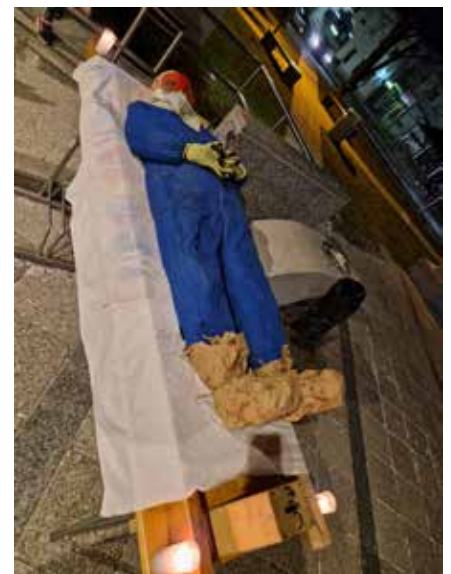
Pokop pusta v Desklah.