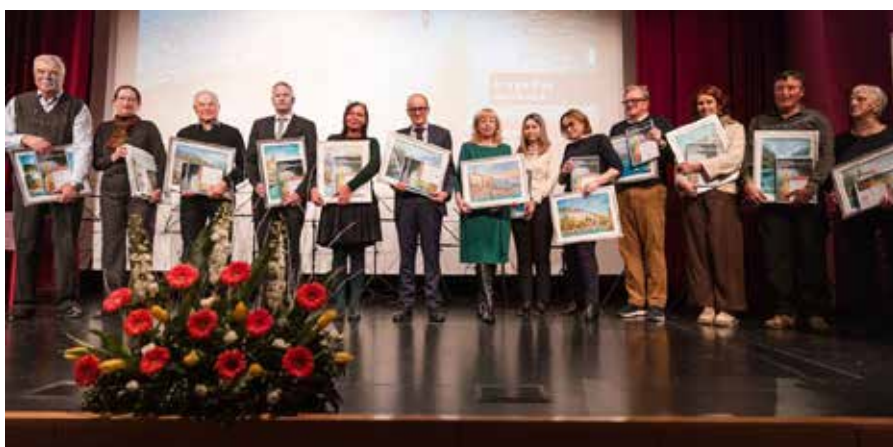
Nagrajenci društva OZA, ki so nagrade prejeli na slavnostni prireditvi.

Končno je prišel 19. december 1996, v proizvodnji plošč in cevi so se zbrali prva