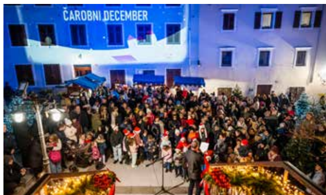
Prižig lučk 5. decembra v Kanalu.