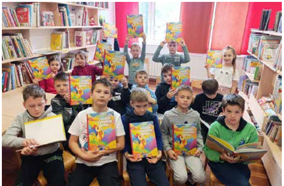
3. razred OŠ Deskle s slikanicami Legenda o petelinu Vinku .

A tokratni 2. april učencem ni prinesel le spodbude za branje in raziskovanje pra-