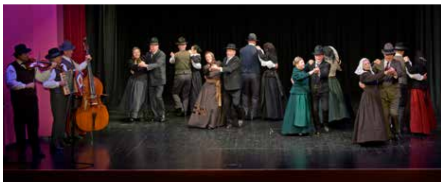
Folklorna skupina Kal nad Kanalom

Folklorno popotovanje je potekalo v organizaciji JSKD OI Nova Gorica ob podpori Občine Kanal ob Soči, KS Anhovo - Deskle, DU Deskle - Anhovo in KD Svoboda Deskle.