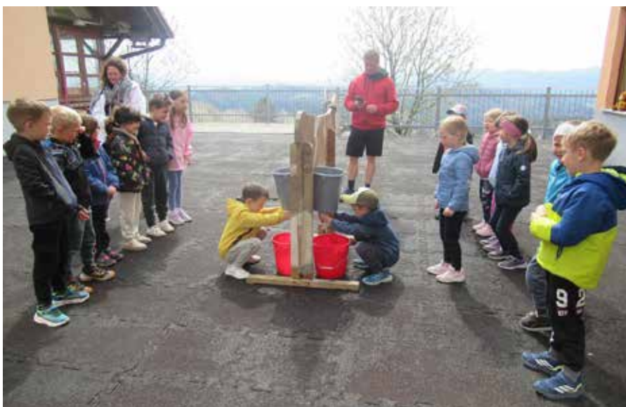
Tekmovanje v molzenju krave.

Takoj po zajtrku smo šli hrabro premagovat plezalno steno. Potem smo se odpravili v gozd, kjer smo se igrali v že zgrajenih bivakih. Te smo tudi mi malo dogradili, popravili, preuredili. Po kosilu in popoldanskem počitku smo se spremenili v prave peke. Pripravili in spekli smo si žemljice, ki smo si jih privoščili pri večerji. Pred njo pa smo se še enkrat odpravili v gozd, kjer smo prisluhnili zvokom narave in tudi sami zapeli ob spremljavi inštrumentov iz naravnih materialov. Priredili smo pravi gozdni festival. Po večerji smo zaplesali skupaj s šolskimi otroki iz Ljubljane. Ob plesu in glasbi smo veselo zaključili naše letovanje na Medvedjem Brdu. Ampak to ni bil še pravi konec. Kajti pred odhodom domov smo bili še ves dopoldan zaposleni. Opazovali, spoznavali in božali smo različne vrste živali. Tekmovali smo v molzenju krave, lovljenju koz in igri »štrbunk«. Na koncu smo bili seveda nagrajeni. Dobili smo priznanja za pogum, samostojnost in dobro voljo, ki smo jo pokazali na Medvedjem Brdu. Domov smo se vrnili utrujeni, a polni lepih spominov.