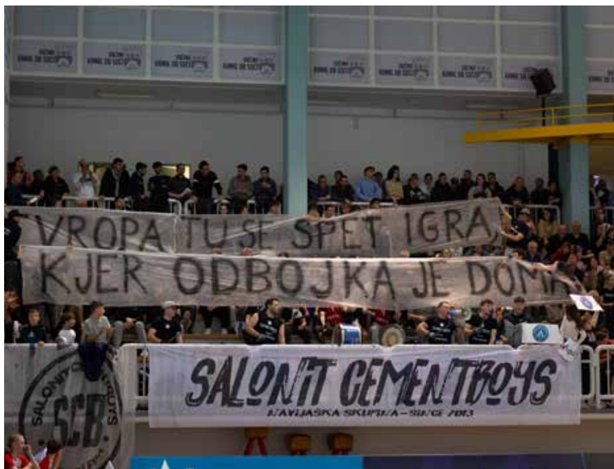
Navijaško vzdušje na evropski tekmi v Kanalu.

Letošnja sezona za mlajše kategorije še ni čisto zaključena, je pa do sedaj za OK Alpacem Kanal že potrdila, da klub ostaja pomemben del slovenske odbojcarske scene v vseh kategorijah, tako v mladinskih kot v članskih vrstah. Evropski večeri, konkurenčnost v domačem prvenstvu in uspešno delo z mladimi dajejo jasno sporočilo, Kanal ima trdne temelje in svetlo prihodnost.