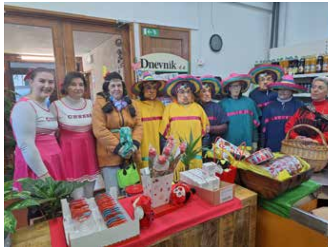
Skupina Društva Šola zdravja v trgovini Fama v Kanalu.