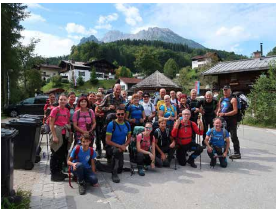
Skupinska fotografija vseh udeležencev na izhodišču Wimbachbrücke.

Naš planinski izlet je bil sicer dvodnevni, izkoristili smo možnost, ki je Sta-