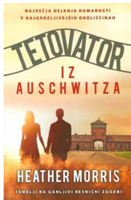
Roman Tetovator iz Auschwitza, iz katerega je citirani odlomek.