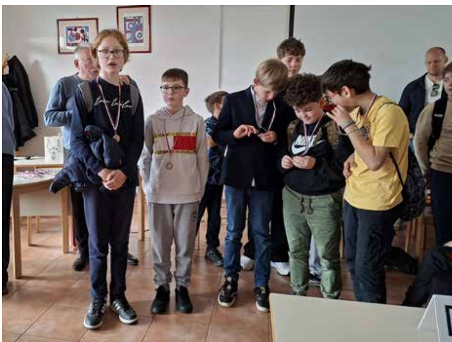
Ekipa OŠ Deskle.

Na ekipno DP za osnovne šole so se uvrstili učenci OŠ Kanal. Prvenstvo je bilo 22. marca 2026 na OŠ Gradec v Litiji. Igrali so v isti postavi kot na regijskem in osvojili 14. mesto.