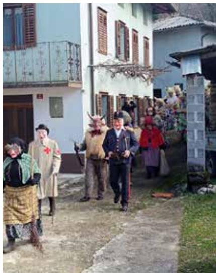
Liški pustje med obhodom po vaseh Kanalskega Kolvrata.

V torek, 17. februarja, so bili del pustne povorke 53. Pustovanja Postojna, dan pred pustno nedeljo, 14. februarja, so se udeležili velikega pustnega karnevala v Ribnici, konec tedna pred tem pa so bili že tradicionalno del otvoritvene etno povorke na Ptuju (7. februar) in pustovanja v Špetru v slovenskem zamejstvu