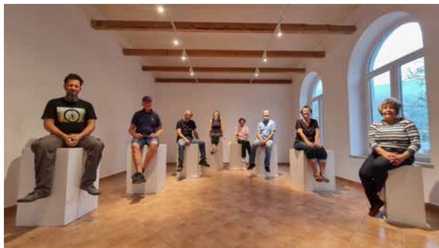
Člani Kluba keramikov Kanal v prostorih galerije Keramost.

Posebna novost, ki pritegne pogled mimoidočih, je osvetljenost galerije v večernih urah. Ko pade mrak, Keramost postane svetilnik kulture; skrbno usmerjena razsvetljava poudari teksture razstavljenih keramičnih del in vabi k ogledu skozi velika okna, kar galeriji daje pridih svetovljanskosti.