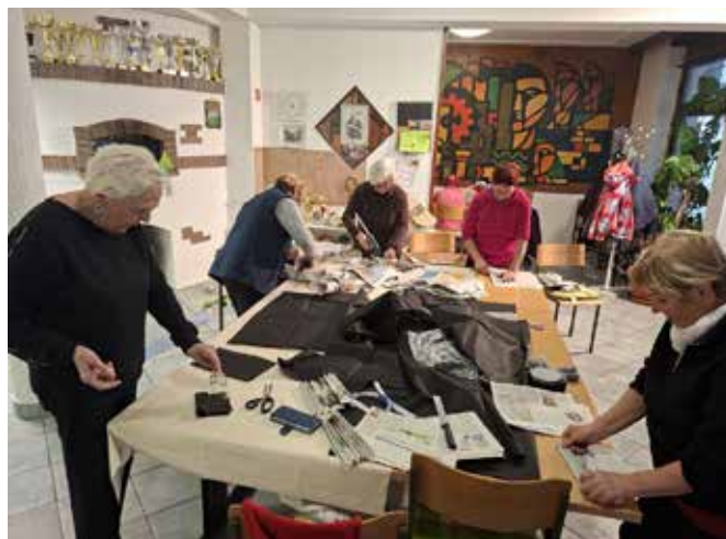
Izdelava pustnih kostumov in dodatkov v prostorih Medgeneracijskega centra Pri Tinci.