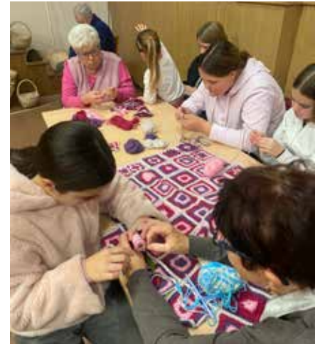
Kvačkanje na Prazniku jeseni.