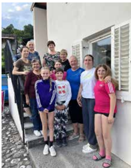
Klekljarska skupina Ročinj danes.

Ker želijo, da so njihove čipke lepe, pravilno izdelane in sledijo trendom, je potrebno izobraževanje. Zato se udeležujejo raznih delavnic, sledijo izdanim publikacijam, obiskujejo razstave, ki jih organizirajo druga društva, seveda pa čipke s ponosom razstavijo ob različnih priložnostih.