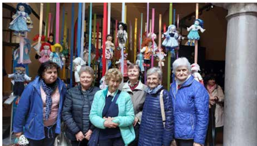
Članice skupine ročnih del DU Kanal z razstavljenimi punčkami.

izdelanih edinstvenih punčk in fantkov iz cunj, 28 tudi iz Kanala, ki so jih za to priložnost izdelale prostovoljke – članice skupine ročnih del DU Kanal.