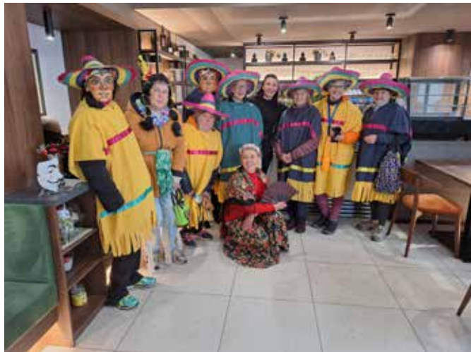
Skupina Društva Šola zdravja v kavarni Aura v Kanalu.

po vsakodnevni vadbi. Hvala vsem za to- pel sprejem in pogostitev.