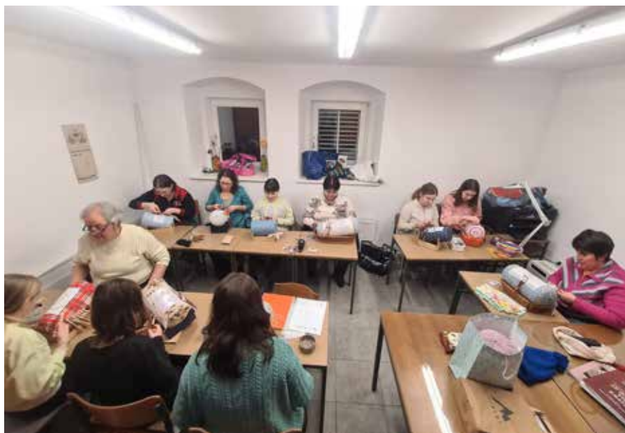
Klekljarice pri delu v Domu Valentina Staniča v Ročinja.

Veliko čipk tudi podarijo, ker se pogosto vključujejo v različne dobrodelne projekte, ki jih organizirajo same ali sodelujejo pri projektih drugih društev ali posameznikov. Na te izdelke so še posebej ponosne, saj ko stopijo skupaj, postane nemogoče mogoče. Nagrada za njihov trud je veselje, ko se projekt zaključi in pred njihovimi očmi zasije končni izdelek.