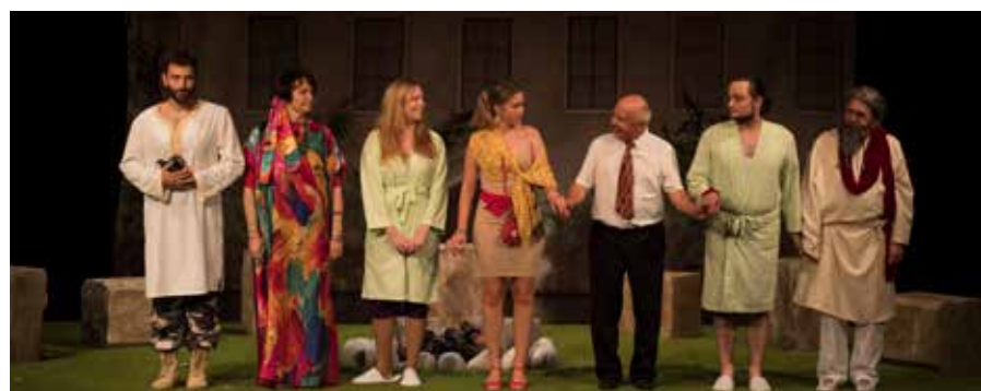
Igralci v predstavi Ritrit. Avtor: Nejc Laščak

V procesu postavljanja na oder smo besedilo skrajšali in precej spremenili njegov konec, končna dolžina predstave je 100 minut, prvi gledalci pa so pohvalili predvsem zanimivost, uravnoteženost in izčiščenost vseh vlog, nekoliko bolj tuja jim je bila tema vzhodnjaške oziroma new age duhovnosti.