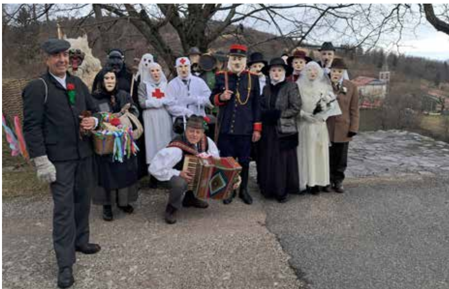
Skupinska fotografija pustarjev v Kalu nad Kanalom.