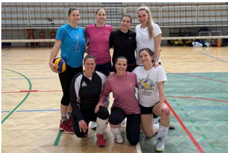
Zmagovalke ženskega turnirja Sour mix.