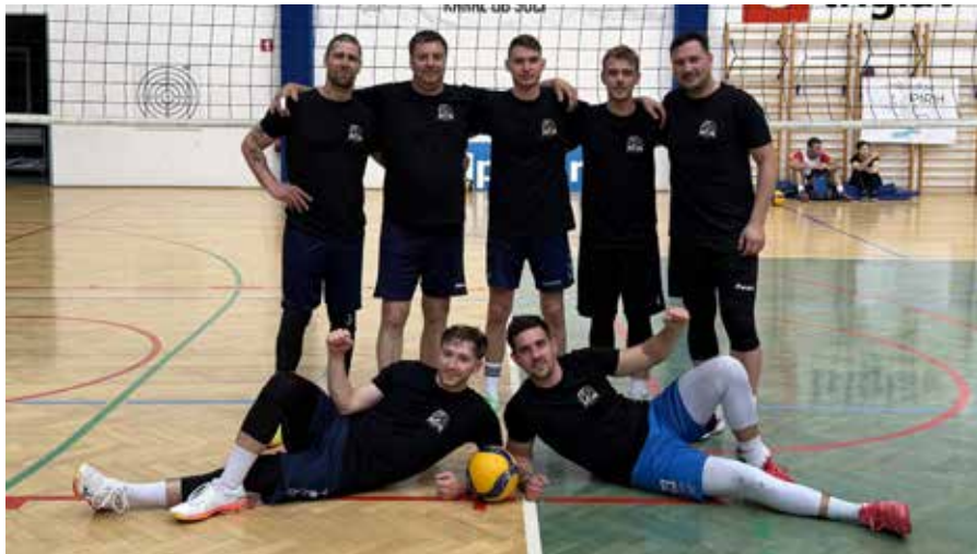
Zmagovalci moškega turnirja Raijin volley.

Turnir tako ostaja pomemben športni in družabni dogodek, ki povezuje skupnost in hkrati uspešno promovira Kanal kot kraj aktivnega in kakovostnega preživljanja prostega časa.