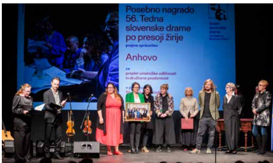
Ustvarjalci predstave Anhovo so na 56. TSD prevzeli posebno nagrado za preplet umetniške odličnosti in družbene prodornosti.

Predstavo Anhovo bodo v Slovenskem narodnem gledališču Nova Gorica ponovili v nedeljo, 7. junija, ob 17. uri. Po predstavi bo na sporedu pogovor z ustvarjalci. Vabljeni!