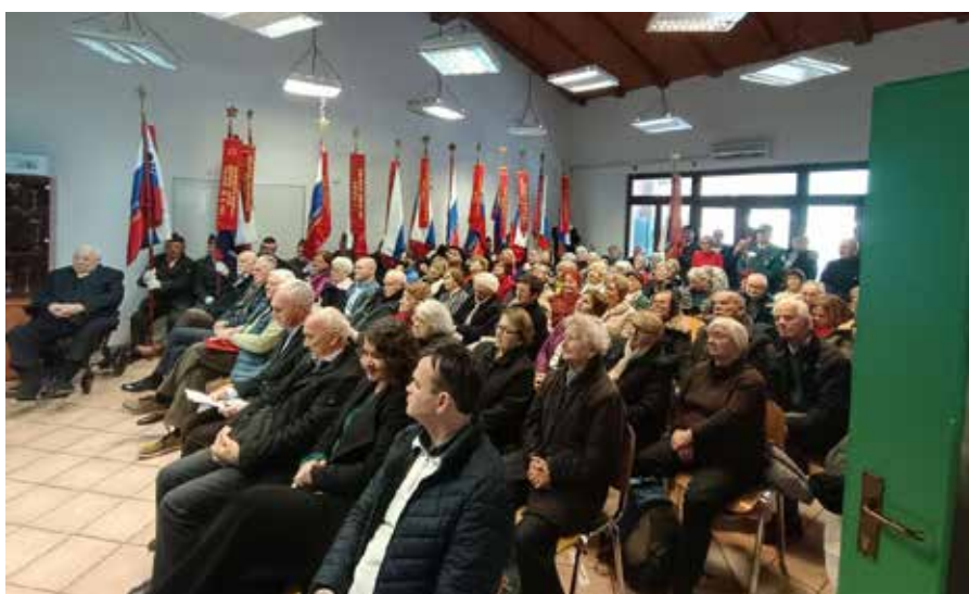
Dvorana v Morskem je bila polna do zadnjega kotička.

vrnila preko Soče v Slovenijo. Briško-beneški odred, ki je tedaj deloval v sestavi enot XXX. divizije, pa je uspešno nadaljeval svoje vojaško, kulturno in narodnostno poslanstvo v Slovenski Benečiji in Goriških brdih vse do končne zmage.