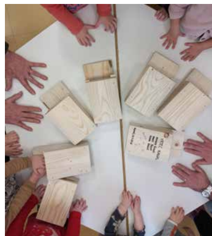
Škratki izročili solnice predstavnikom LD Kanal

Veseli smo, da lahko tudi mi pripomoremo k temu, da bodo gozdne živali lažje preživele zimo.