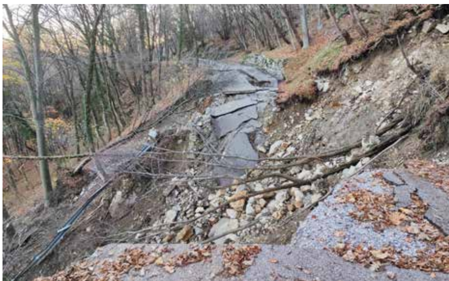
Plaz je odnesel precejšen del ceste pod Korado.

Pomemben del dejavnosti po neurju je bil natančen popis škode. Občina je z zbiranjem vlog oškodovancev začela 26. novembra 2025, zbiranje pa zaključila 15. decembra 2025. V sistem AJDA je bilo nato do 7. januarja 2026 vnesenih skupno 173 vlog. Največ škode je bilo zabeleženo na lokalni infrastrukturi, in sicer več kot 2,3 milijona evrov, sledijo