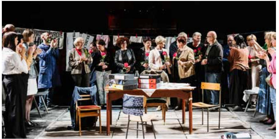
Domačini iz Anhovega na odru po premieri 28. maja 2025.