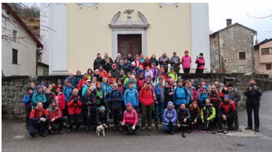
Udeleženci letošnjega Pohoda na Čičer ob kulturnem prazniku pred cerkvijo v Ročinju.

Ker je varnost pohodnikov vedno na prvem mestu, smo bili organizatorji primorani traso prilagoditi razmeram. Letošnji pohod je zato potekal manj po gozdnih stezah in več po cestah, kar je traso nekoliko podaljšalo. Skupno smo prehodili približno 16 kilometrov, a dob-