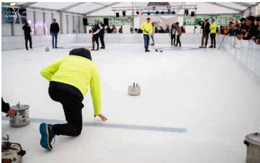
Tretje tekmovalje v curlingu z ekonom loncem na dršališču v Desklah.