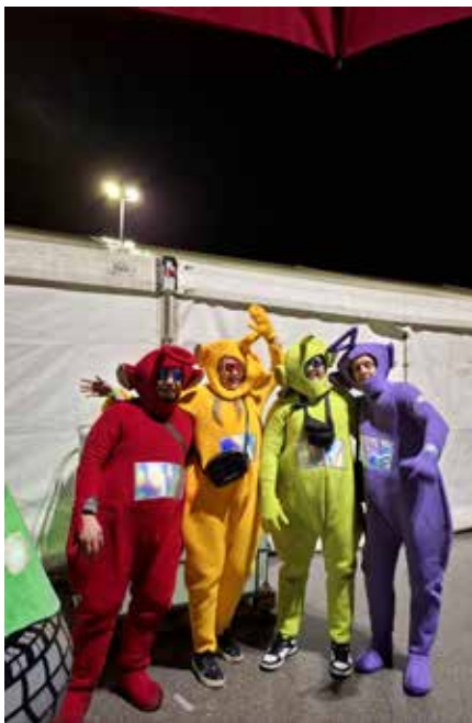
Pustarji v Desklah.