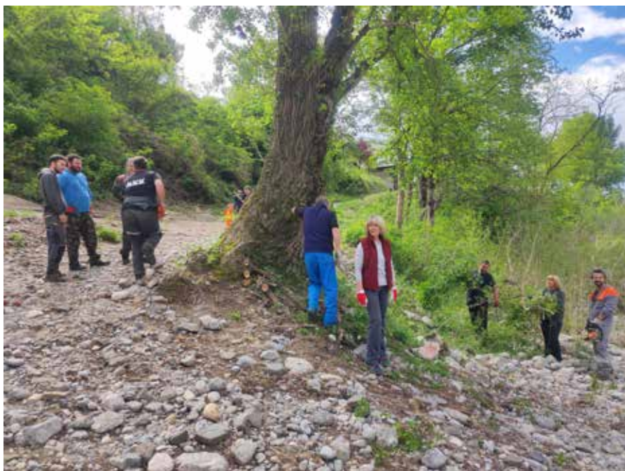
Čistilna akcija na plaži v Kanalu marca 2025.

Med nedavnimi ukrepi velja omeniti odstranitev plakratnih mest izpred klesanega kamnitega zidu na Kolodvorski klančini podhoda pod železnico ter izdelava nove oglasne deske in premestitev na tržnico, s čimer se je izboljšala pod-