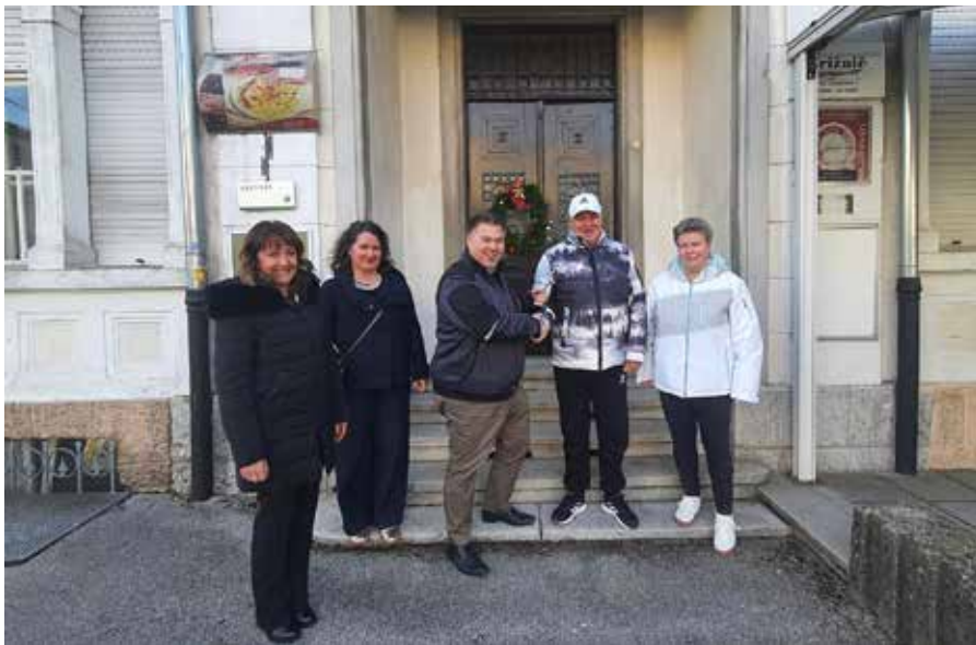
Primopredaja ključev Gostišča Križnič.