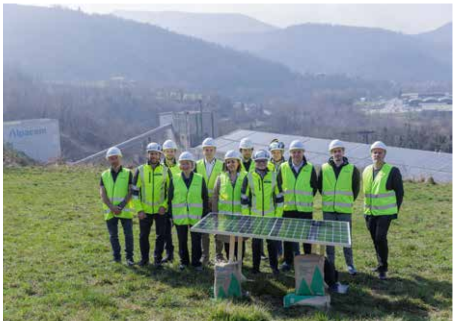
Predstavniki družb Alpacem Cement, Enertron in arhitekturnega biroja Sadar + Vuga po podpisu pogodbe na lokaciji v kamnolomu.

Sončni elektrarni so na internem glasovanju zaposleni v obeh družbah nadeli ime 'Aurora', ki simbolno ponazarja prihod sonca ter pomembnost projekta v energetske preobrazbi podjetja Alpacem Cement, je družba zapisala v sporočilu za javnost.