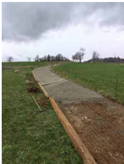
Betoniranje makadamske poti nad Kanalskim Vrhom.