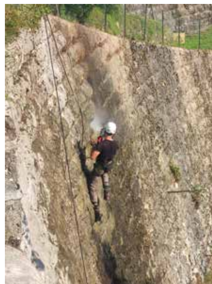
Visokotlačno pranje kamnitega zidu pri slaščičarni Rafaelo.

V Gorenji vasi je pri dejavnostih KS dober odziv, vaščani se številčno odzivajo na čistilne akcije, sodelujejo pri urejanju vasi, KS jim je namenila sredstva za nakup montažnega šotora, ki omogoča skupna druženja, kajti v vasi družabnega prostora nimajo.