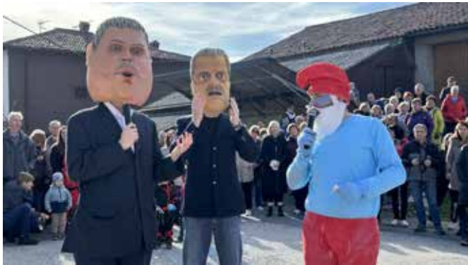
»Veliki trije« so v Morskem razglabljali o prihodnosti naselitve smrkcev v Morsko.