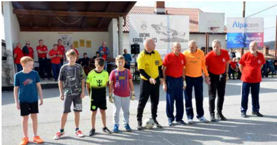
Levo od sodnika v rumenem mlajši nogometaši in nogometašice ekipe »zvezd«, desno prva in druga generacija NK Lig.

Na prireditvi je bil predstavljen zbornik z naslovom Spomini ob 50. obletnici