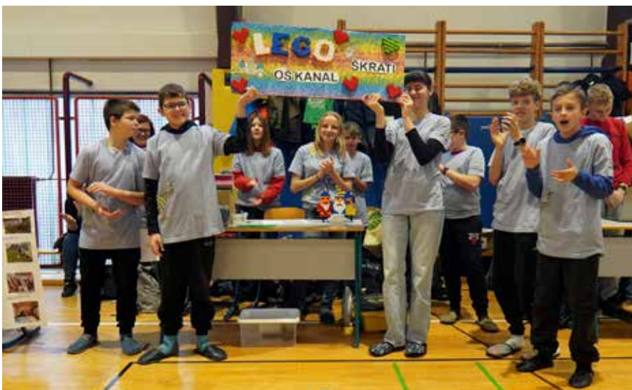
Regijsko tekmovanje First Lego League v Kamniku.

Učenci interesne dejavnosti First Lego League so se v soboto, 17. januarja 2026, udeležili regijskega tekmovanja v Kamniku. Tekmovanje je sestavljeno iz štirih ocenjevanj: tekme robotov, vrednot v ekipi, predstavitev Lego robota ter predstavitev inovativnega projekta. Letošnja tema inovativnega projekta so bili poklici, povezani z arheologijo. Učenci so prejeli bronasto priznanje, a se žal na državno tekmovanje niso uvrstili. Kljub temu svoje delo in srečanja ob robotski mizi nadaljujejo in kujejo nove ideje za naslednje šolsko leto.