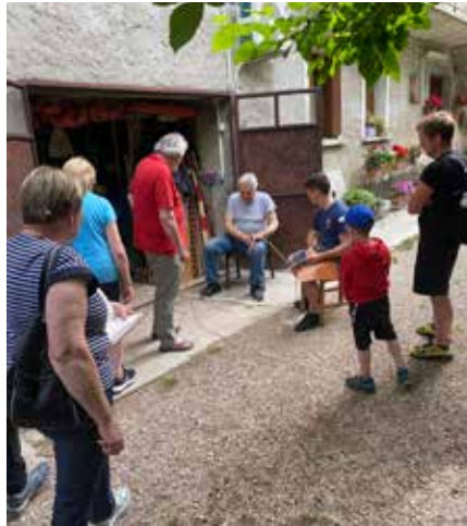
Pri Toniju v Kodermacih smo se učili pletarskih veščin.