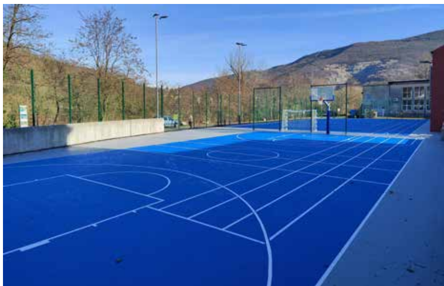
Prenovljeno igrišče v Desklah.

Prenovljeno igrišče s svojo dostopnostjo in urejenostjo spodbuja aktivno preživljanje prostega časa ter krepi povezanost med prebivalci. Hkrati pa ponuja ustrezne pogoje tako za izvajanje športnih dejavnosti v osnovni šoli in vrtcu kot tudi za razvoj športnih dejavnosti širše v občini ter pomembno prispeva k večji kakovosti bivanja v Desklah.