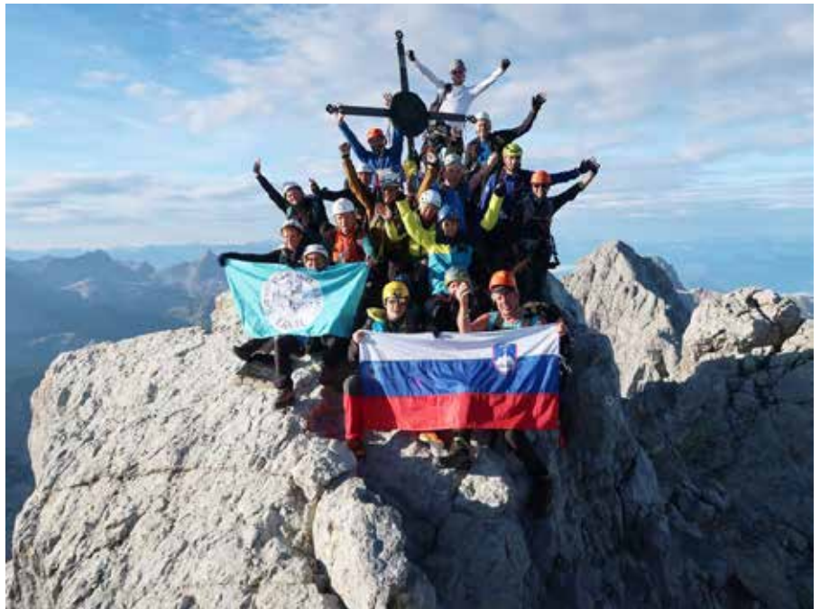
Skupina, ki je dosegla najvišji vrh, Watzmann Mittelspitze (2713 m).

Novi termin sredi lanskega poletja naj bi vsaj snežno nevarnost odpravil, a je, glej ga zlomka, konec julija vrh in kočo znova pobelilo in izlet je bil v drugo odpovedan, zaradi velike zasedenosti kočice pod vrhom pa je bil vprašljiv tudi ponoven poskus. Prvi termin, v katerem je bilo mogoče zagotoviti dovolj postelj za vse, je bil šele v začetku septembra in vodstvu PD VS Kanal ni preostalo drugega kot rezervirati in upati na ugoden razplet.