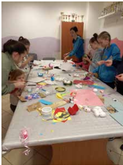
Delavnica izdelovanja velikonočnih voščilnic v Levpi