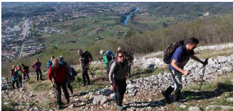
Utrinek z letošnjega pohoda po stopinjah Valentina Staniča.

Pot nadaljuje mimo cerkvice sv. Genderce in se zaključi v Kanalu ob Soči. Celotna trasa meri dobrih 25 kilometrov, pri čemer pohodniki premagajo več kot 1100 višinskih metrov. Udeležencem sta omogočeni dve krajši različici pohoda – južna in severna polovica trase.