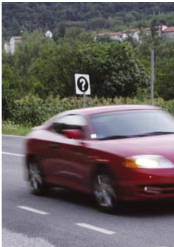
Še veste, koliko takih točk je bilo? (Foto: Občina Kanal ob Soči)

V občini se je lani zgodilo 58 prometnih nesreč, pri tem pa je en človek izgubil življenje, štirinajst ljudi je bilo hudo telesno poškodovanih, šestnajst ljudi pa je dobilo lahke telesne poškodbe. Policija navaja, da so največkrat vzroki za prometne nesreče nepravilna stran in smer vožnje in neprimerna hitrost. Prometna varnost se je v letu 2005 sicer poslabšala, je pa zadovoljivo, da v prometnih nesrečah ni umrlo več ljudi kot poprej. Tudi leta 2004 je umrl en človek. Največ in najhujše prometne nesreče se dogajajo na glavni cesti od Nove Gorice do Tolmina, zato bodite previdni, ko se odpravite na pot.