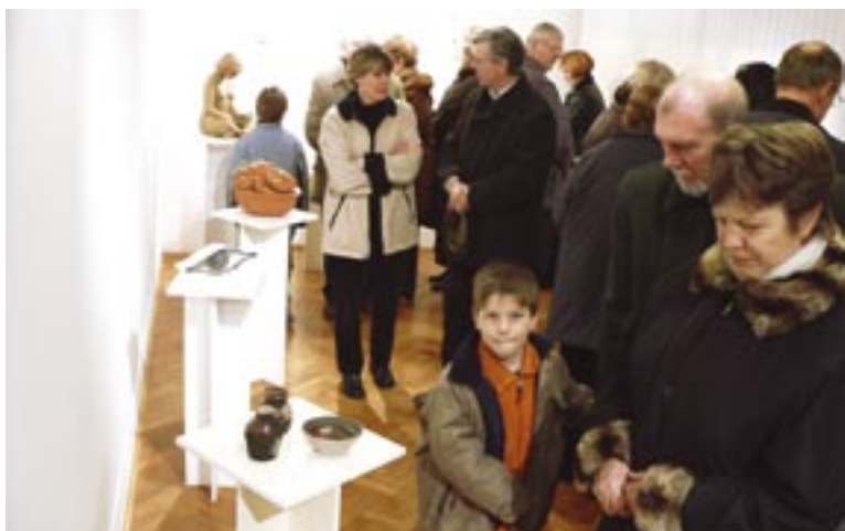
Glinene izdelke si je ogledalo veliko ljudi.

V tednih kulture je Kulturno društvo Svoboda Deskle priredilo razstavo keramičnih izdelkov Kluba keramikov Prosvetnega društva Soča iz Kanala.