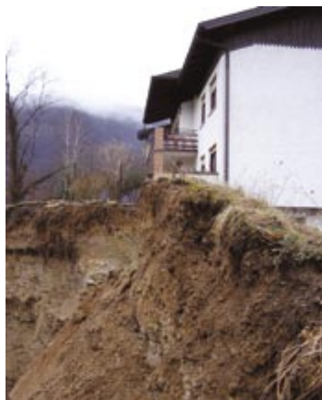
Brežina pri hiši v Plaveh je zgrmela v naraslo Sočo.

Med tem časom pa so si strokovnjaki podjetja Geoinženiring že ogledali brežino in izdelali predlog sanacije. Na posebnem sestanku so predstavniki MOP iz Ljubljane, MOP ARSO iz Nove Gorice, Zavarovalnice Maribor, Soških elektrarn, štaba civilne zaščite in občine sklenili, da morajo brežino vsekakor sanirati, saj bi bili v nasprotnem primeru v nevarnosti tudi cesta in železnica. Z interventno sanacijo bodo začeli junija, ko bo gladina Soče primerno nizka, dela pa bodo stala med 30 in 35 milijonov tolarjev.