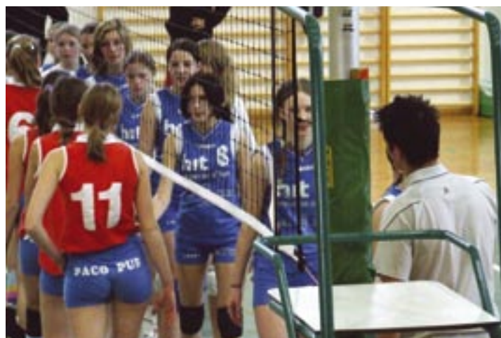
Mlade odbojkarice OK Neptuna so se zelo dobro odrezale.

Naš klub intenzivno dela in zbira sponzorska sredstva za kvalifika-