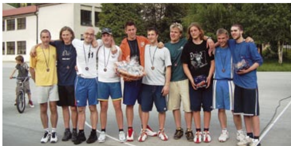
Zmagovalci iger.

V letu 2004 se je iger udeležilo šestnajst ekip, lani pa že 22. Vsi rezultati tekmovanj in fotografije so objavljene na naši spletni strani