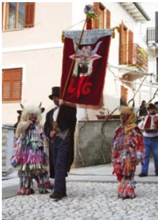
Pust je najprej obiskal Kanal.

Staro leto je za nami, zakorakali smo že kar globoko v leto 2006. Tako kot je ta zima v znaku obilice snega, pa bo to leto v znamenju volitev. Oktobra bomo izbrali tiste ljudi, ki nas bodo vodili, razveseljevali in jezili v naši občini Kanal ob Soči.