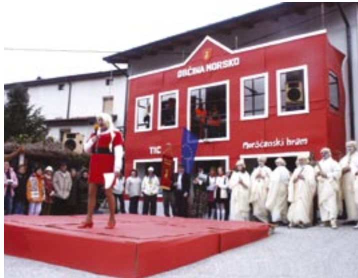
Najprej so v Morskem ustanovili občino.