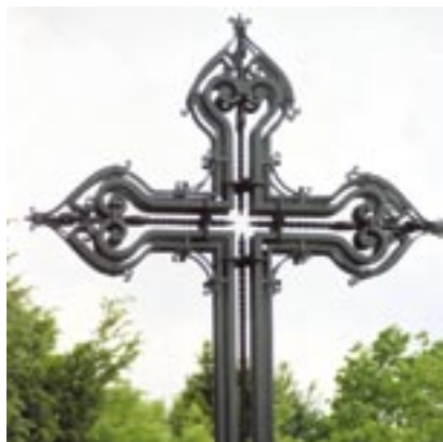
Lokovski kovač je skoval križ po njenih načrtih.

Elza Pavšič se je že med študijem navduševala nad oblikovanjem interjerija, ki mu je še vedno