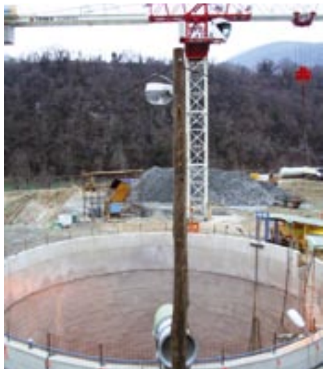
Ajdovsko Primorje koplje jašek za strojniško ČHE Avče.

Črpalno hidroelektrarno Avče so pričeli graditi v letu 2004. Ajdovsko Primorje, ki je izvajalec gradbenih del, trenutno koplje strojnični jašek, ki bo globok osemdeset metrov, in pripravlja traso dva kilometra dolgega cevovoda.