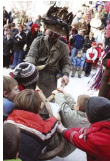
Liški pustje so preganjali zimo v Kanalu.