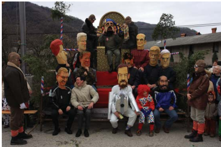
Zmagovita Zmagova zasedba prestola

Ajdovci so preveč menciali in Morščani so nemudoma pograbilo priložnost za prepoznavnost in razvoj. Slovesnost s slavnostnim gostom Zmagom Jelinčičem Plemenitim