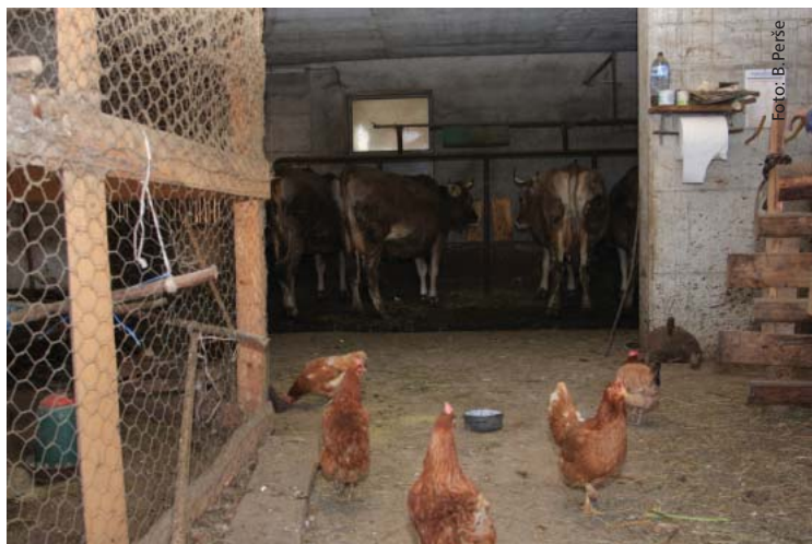
Biodinamična kmetija s kravami in perutnino

Delo na kmetiji je tako raznovrstno, da samo ena generacija težko pre-živi brez pomoči mlajših ali pa starejših. Pregovor pravi "Ko ta mlada