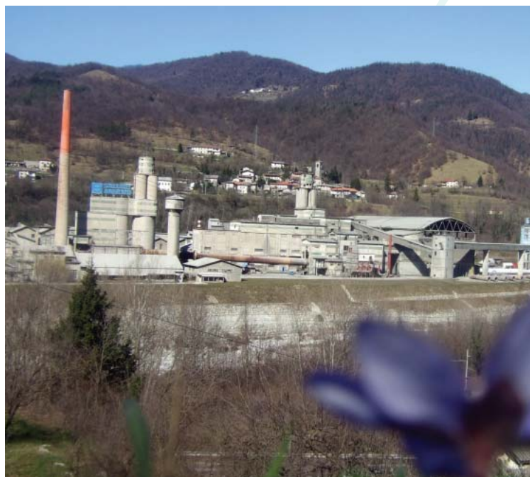
Počasi izpod zaprašenega oklepa