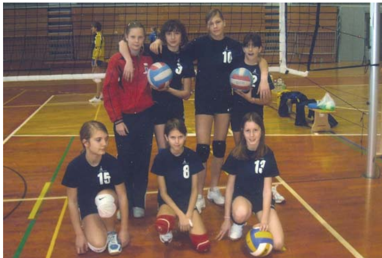
Mala odbojka za deklice do 13. leta starosti

Ekipi deklic do 11. leta ("mini odbojka") in 13. leta ("mala odbojka") sta se namreč uvrstili v finalni del tekmovanja, prav tako so Kanalke v vrhu lige za starejše deklice (do 15 let). Klubska dejavnost pa zaokrožujejo še kadetinke (do 17 let) in članice, ki uspešno nastopajo v 3. državni odbojarski ligi – zahod. (pm)