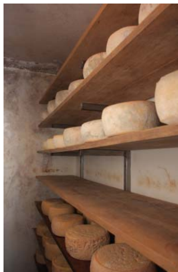
V sirarni do sira, skute in masla

Preparate škropimo kot gnojilo ali uporabimo za utrjevanje rastlin. Čaje iz naštetih zelišč pa uporabljamo kot sredstvo proti škodljivcem in boleznim na rastlinah. S škropljenjem je veliko dela, vendar so rezul-