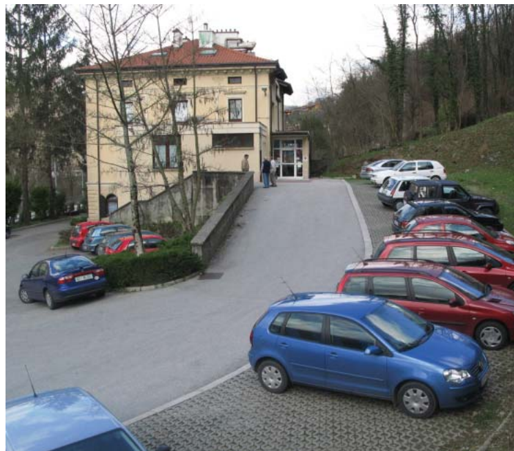
V Kanalu včasih zaprti obe ambulanti

rovalnica pripravila v Novi Gorici, se zdravnici nista mogli udeležiti, ker je bil med njunim delovnim časom.