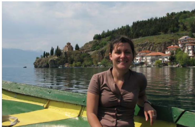
Vesna na Ohridskem jezeru

Spominjam se, ko mi je oče pripovedoval o njej. Tam je pred tridesetimi leti služil vojaški rok. Veliko je imel povedati o 'zajebanih' oficirjih, pokvarjenih konzervah s hrano, pijanih vojaki iz različnih držav bivše Jugoslavije, Makedonkah ter lepota Dojranskega jezera.