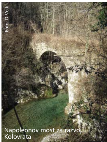
Napoleonov most za razvoj Kolovrata

Vrednost obnove tega več kot 200 let starega mostu znaša 65.000 evrov in vključuje še postavitev novega mostu.