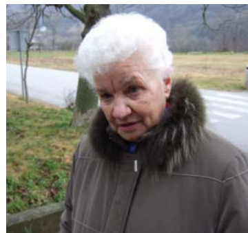
L. Rahotina: Pogrešam civilno iniciativo

ni tudi priznava napredek, vendar meni, da bo pot do čistega in zdravega okolja še dolga.