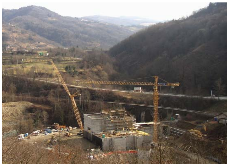
CHE Avče: Naložba naj bi se povrnila v 13. letih