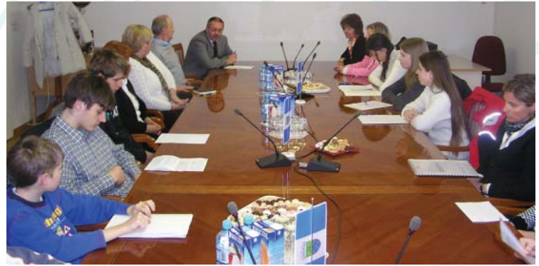
Mladi parlamentarci o svojem prostem času.

Delegacija učencev se je udeležila tudi parlamenta v Novi Gorici ter v Ljubljani.