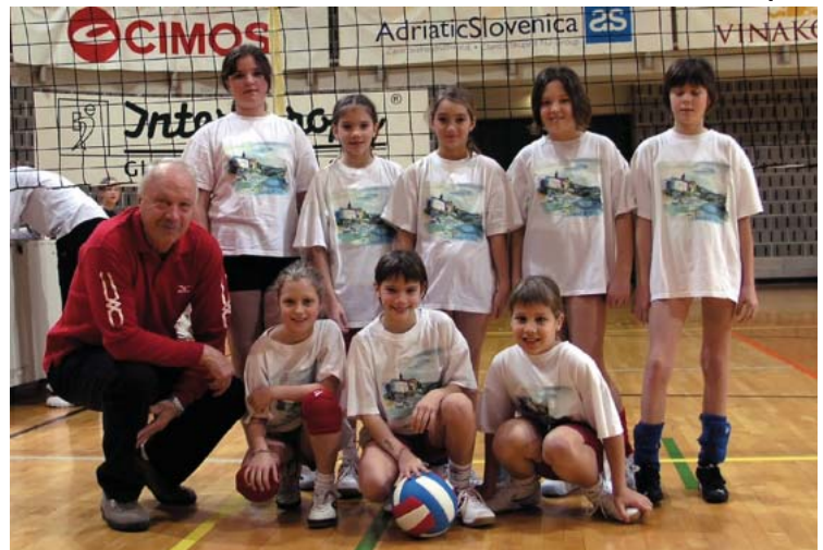
Mini odbojka: Letos prvič v tej selekciji