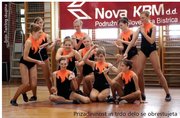
Prizadevnost in trdo delo se obrestujeta