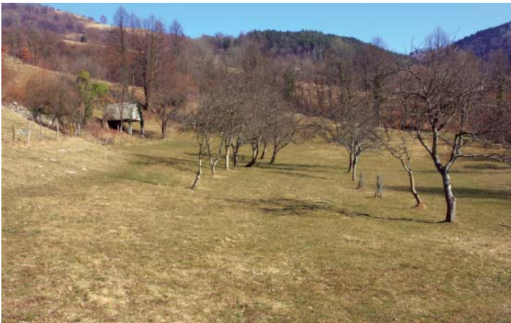
Vzpostavitev naravnega reda - tudi v sadovnjaku

Seveda dandanes stvari niso več tako preproste, saj je človek s poseganjem v naravo ustvaril veliko nereda. Kopičijo se težko razgradljivi odpadki, zemlja je zaradi dolgotrajne uporabe industrijsko izdelanih gnojil, strupov proti škodljivcem in plevelom ter zdravil postala revna in neplodna. Tudi rastline, ki zrastejo v taki zemlji, niso zdrave niti polnovredne in ne morejo pravilno prehraniti živali in človeka. Posledice so izbruhi bolezni, med njimi je vedno več takšnih, ki jim znanost ni kos. Z biodinamičnim načinom obdelave zemlje pa si prizadevamo ponovno vzpostaviti naravni red.