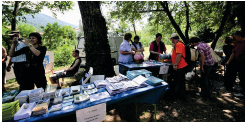
Na stojnicah so domačini in gostje predstavili pestro paleto ustvarjalnosti in dejavnosti.

V srečanje smo vložili ogromno dela. Ob tem se zahvaljujemo vsem društvom in posameznikom, ki so nam prostovoljno pomagali. Tudi tokrat smo dokazali, da smo dobri gostitelji in da znamo izpeljati prireditve na zavidljivem nivoju.