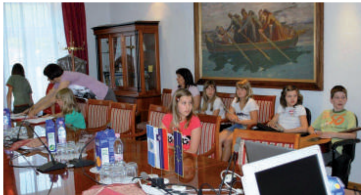
Dobri 'odnosi' so nagrajeni