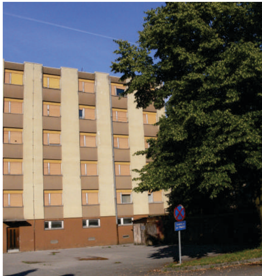
Bo nekdanji samski dom v Desklah dom upokojencev?

Razloge za manjše število prijav v domovih za upokojence gre iskati tudi v gospodarski krizi, saj pokojnina lahko ublaži socialno stisko številnih družin.