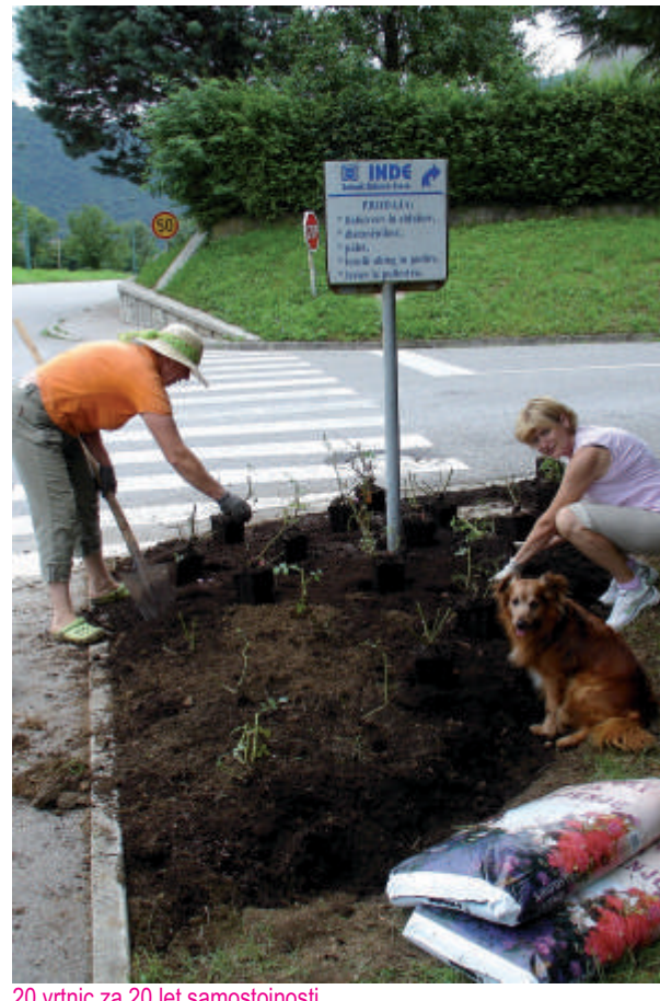
20 vrtnic za 20 let samostojnosti