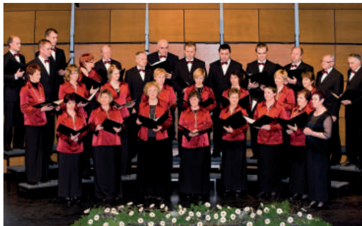
MPZ Jože Srebrnič Deskle

predstavil vedute Solkana in abstraktna dela s pomenljivimi naslovi, 18. februarja pa so razstavo pripravili člani Likovne skupine KD Svoboda Deskle. Na svoj račun so prišli tudi otroci, ki so si lahko ogledali dve predstavi: brezčasno zgodbo o leseni lutki Ostržek v izvedbi Gledališke šole Studio Art in SSG Trst ter predstavo Životok- Circle of life skupine Artizani iz Ljubljane. Slednja je prejela nagrado za najboljšo predstavo v celoti na festivalu mladinskih in gledaliških skupin Vizije 2010.