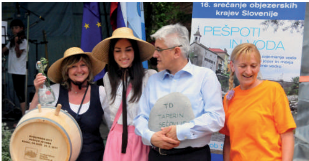
Na slovesnosti se nam je pridružil minister za okolje in prostor Roko Žarnič.