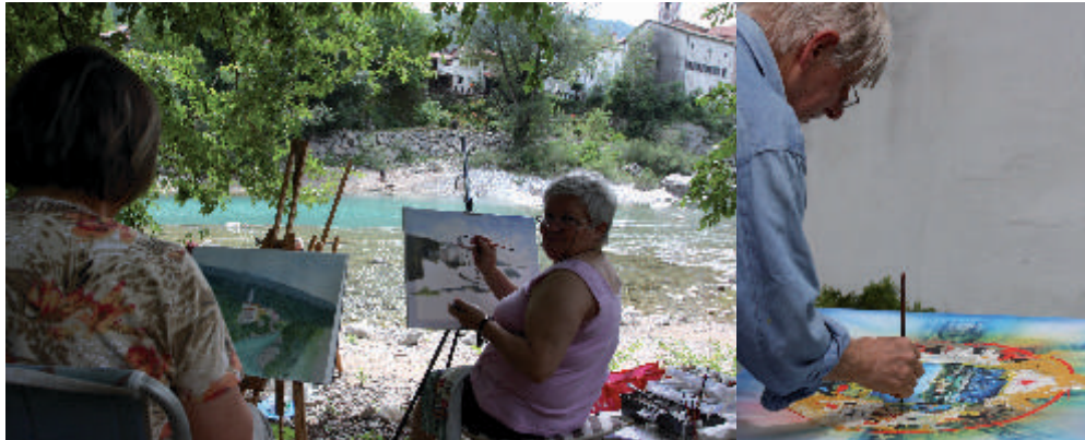
Veduta Kanala s plaže

prelepih in zanimivih koticov. Skoraj dvajset udeležencev si je po okrepljeni malici poiskalo primerno senčico, kjer so do poznih popoldanskih ur ustvarjali in se med seboj spoznavali. Člani domače likovne skupine, kakor tudi gostje iz Italije in Brd so bili nad uspešnim dnevom zelo navdušeni. Po večerji v kampu so se zadovoljni poslovili z obljubo, da bodo nastala dela sredi avgusta razstavili v kanalski Galeriji Rika Debenjaka.