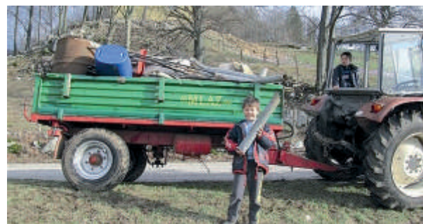
V pomoč je bil tudi traktor