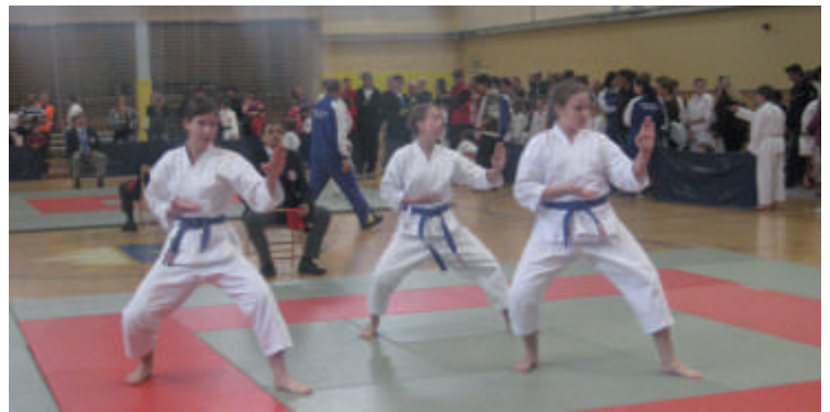
Tekmovanje v katah

Naš klub je zastopalo 15 tekmovalcev, ki so z dobrimi skupnimi nastopi priborili bronasto medaljo