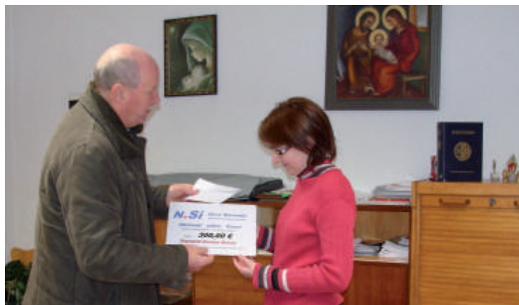
Predaja čeka za družini

Člani občinskega odbora NSi Kanal pa ugotavljamo, da je poleg dobre in tople besede ter lepih želja v naši neposredni sosesčini še marsikatera družina, ki je v teh kriznih časih potrebna tudi finančne pomoči. Zavedamo se namreč, da živimo v času gospodarske krize, krize vrednot in nenazadnje tudi krize družine. Zato smo se odločili, da namesto božično-novoletnih voščilnic nekemu polepšamo praznike. Preko župnijske Karitas Ročinj smo dvema družinama v stiski iz naše občine nakazali 300 evrov enkratne finančne pomoči. Prepričani smo, da sta družini sredstva koristno porabili za njihove osnovne potrebe. S podobno pomočjo je OO NSi Kanal v letu 2008 polepšal praznike družinama v Kanalu, v letu 2009 pa družinama v Desklah.