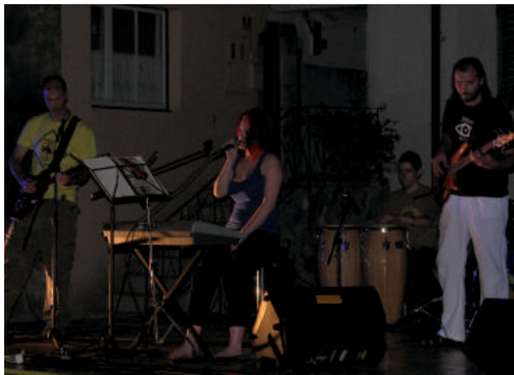
Festival Kontrada 2011, Mojo hišni band