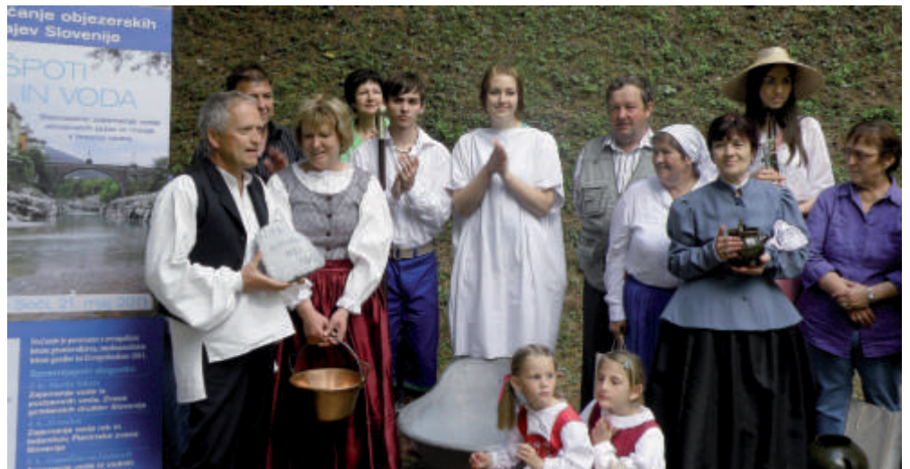
Res zanimiva je bila pisana družina TD v različnih opravah.

Na 'gozdni' poti so si gostje ogledali več kot pol stoletja staro cerkev sv. Kancijana v Britofu.