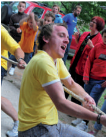
Družili smo se in zabavali: kdo je močnejši?

Minister za okolje Roko Žarnič: „Srečanje turističnih društev objezerskih krajev v Kanalu je še en primer dobre prakse, ki dokazuje, da gre do skrb za vodo, nanjo vezana turistična ponudba in lokalni razvoj z roko v roki“.