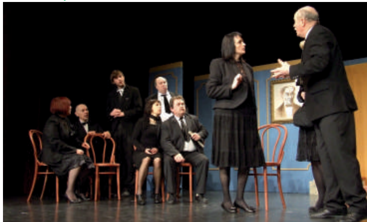
Premiera „Žalujoči ostali“

Komedijo so premierno uprizorili 4. marca letos in do sedaj odigrali 7 ponovitev. Z njo se bodo občinstvu ponovno predstavili 19. avgusta na Kontradi v Kanalu. Vabljeni k ogledu!