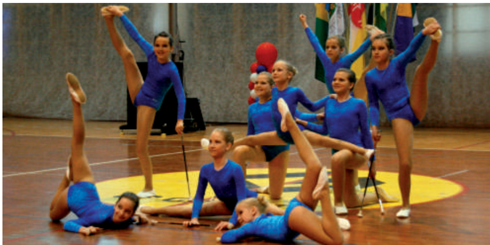
Udeležbo na državnem prvenstvu je finančno podprla Občina Kanal ob Soči, na pomoč sta priskočila še Elektro Primorska d.d. in SENG d.o.o.

„Naše tekmovalke so spodbujali najštevilčnejši in najboljši navijači starši, ki so glasno in športno navijali.“