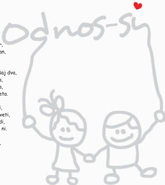
Logo Odnos.si: Petra Mozetič

Prijatelja je lahko dobiti, še lažje ga je izgubiti, a ko ga izgubiš, ga težko nazaj dobiš.