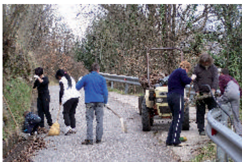
V Ajbi so čistili pot do vasi in breg ob jezu