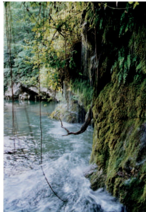
Skrivnostni tolmeni reke Idrije

Priskočile so na pomoč in kmet je izpulil sekiro. Po nesreči so se eni babi v razpoko vkleščili prsti. Duje babe so zagnale vik in krik, da je odmevalo po dolini. Od takrat se ta potok imenuje Babnik.