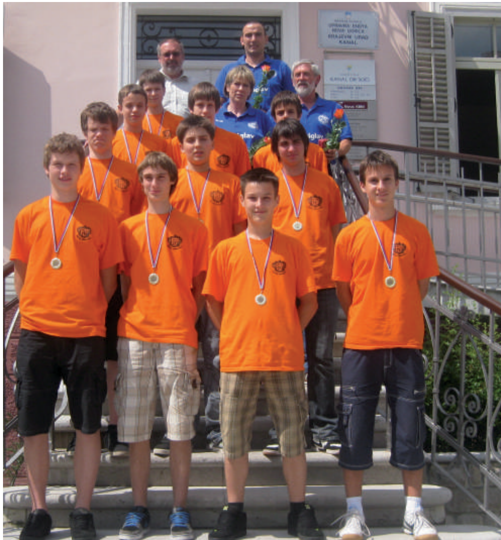
Župan Andrej Maffi je sprejel zlate starejše dečke: „Občina je ponosna na vsako osvojeno lovoriko.“

Zlate starejše dečke je 8. junija sprejel župan Andrej Maffi in jim čestital za izjemen uspeh. Pohvalil je zgledno sodelovanje z OK Salonit Anhovo-Kanal in zagotovil, da bodo okviru svojih zmožnosti, še naprej podpirali delovanje mlajših klubskih selekcij.