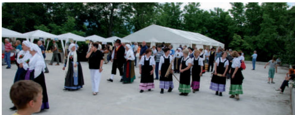
Kulturni dnevi pod Globočakom

Posoški razvojni center kot pooblaščen pravna oseba Lokalne akcijske skupine LAS za razvoj objavlja