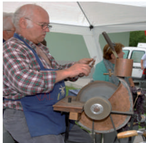
Brusač iz Rezije