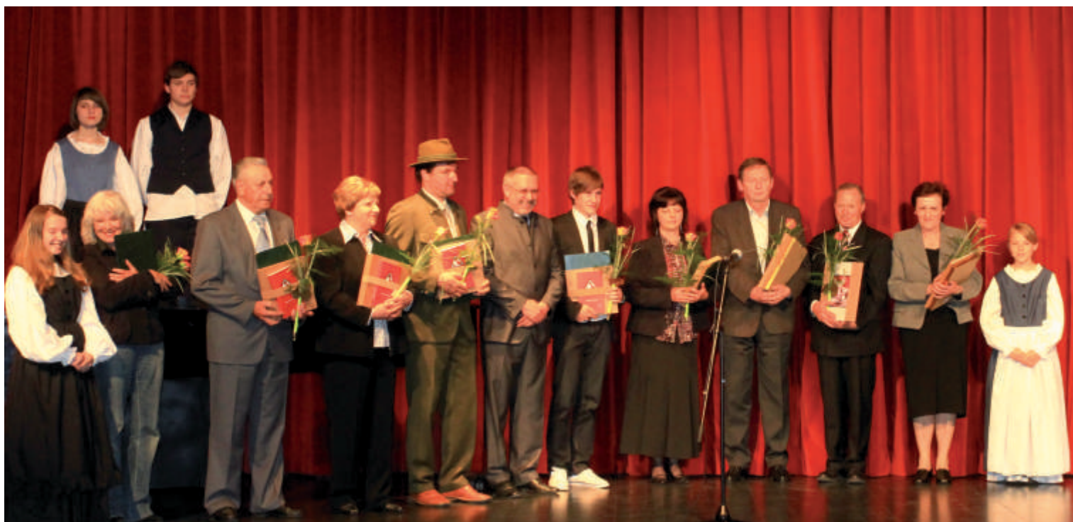
Letošnji občinski nagrajenci