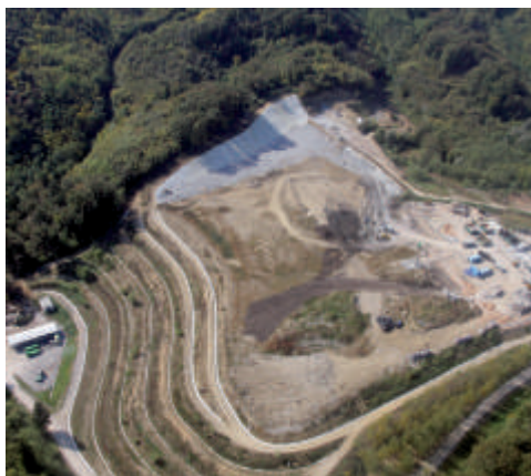
Sedanje odlagališče odpadkov v Stari Gori.

jo povsod v Evropi že uporabljajo kot gorivo v cementarnah ali drugih podobnih termoeenergetskih objektih. Zagotavlja tudi, da je po sestavi ta material podoben gorivom, ki jih v cementarni že uporabljajo. Delež alternativnih goriv v cementarni se je v zadnjih letih gibal med 26 in 50 odstotki, v prihodnje pa načrtujejo, da bodo večino potreb po toplotni energiji zagotavljali z uporabo odpadnih surovin. „S tem bomo zagotovili konkurenčno proizvodnjo cementa z visoko dodano vrednostjo na zaposlenega, to bo omogočalo vlaganja v najboljše razpoložljive tehnike in tehnologije in minimizacijo naših vplivov na okolje in hkrati omogočalo kvalitetna delovna mesta v našem okolju,“ so prepričani v Salonitu.