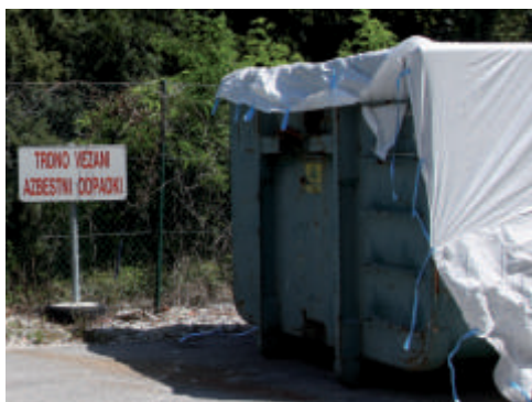
Zbirni center Bodrež, foto: Lea Širok

Kljub temu jih nekateri še vedno odlagajo v naravo