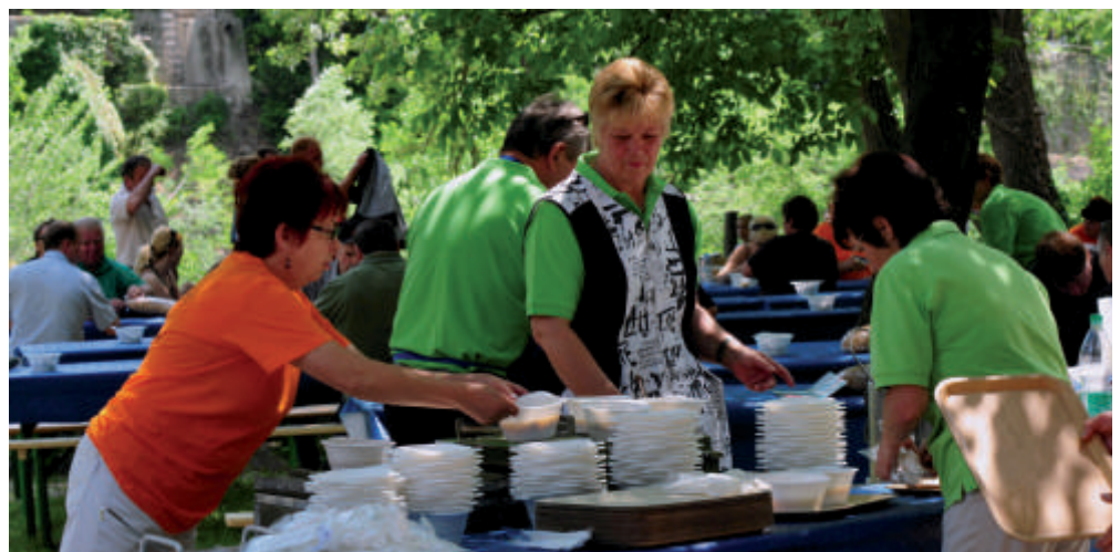
Kosilo za 350 udeležencev v avtokampu Korada ni bilo majhen zalogaj.

V srečanje smo vložili ogromno dela. Ob tem se zahvaljujemo vsem društvom in posameznikom, ki so nam prostovoljno pomagali. Tudi tokrat smo dokazali, da smo dobri gostitelji in da znamo izpeljati prireditve na zavidljivem nivoju.