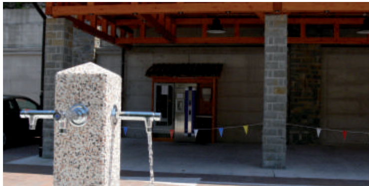
Bo težko pričakovana tržnica zaživela še to poletje?

Če gre za prodajo zelenjave in sadja, mora na Upravni enoti povedati, na kateri parceli prideluje. Parcelo vrišejo v GERK-e in tako pridobi matično identifikacijsko številko kmetije (MID). S tem postopkom pridobi potrdilo, ki je osnova za prodajo na tržnici ali doma. To velja tudi za prodajo svežih gob, zelišč in gozdnih sadežev (čeprav se redki, ki to uredijo). Vsi, ki načrtujejo prodajo na tržnici, morajo tudi na občini izpolniti obrazec oz. najaviti katere pridelke in izdelke nameravajo v tekočem letu prodajati in okvirno koliko. Kdor želi prodajati predelane surovine (marmelada, sir, salame, tudi posušene gobe) pa mora izpolnjevati zahtevnejše pogoje predelave (prostor, HACCP idr.) in registracije v obliki dopolnilnega dela, osebnega dela, s.p. in druge oblike.