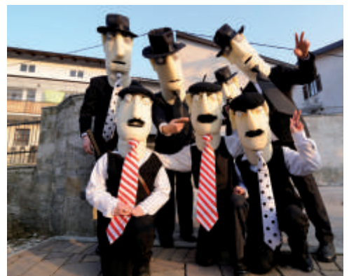
Družbeno satirični morščanski pust