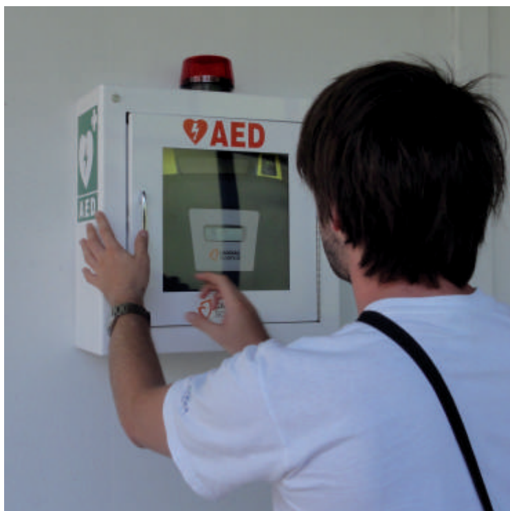
Javno dostopni defibrilator (AED) za reševanje življenj. Akcija za nakup naprave, ki je nameščena na zunanjem delu stolpa gasilskega doma v Kanalu, je s pomočjo številnih lokalnih donatorjev in krajanov izvedel Klub kanalske mladine v sodelovanju s ŠKD Nasejanih.