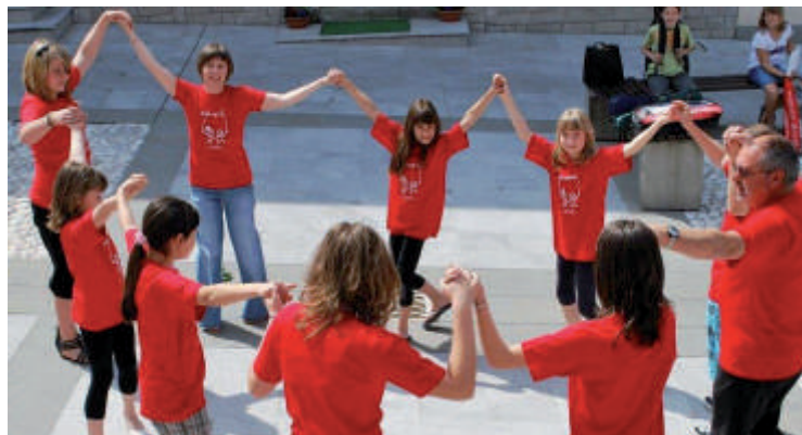
Vzgoja odnosov med ljudmi je pomembna