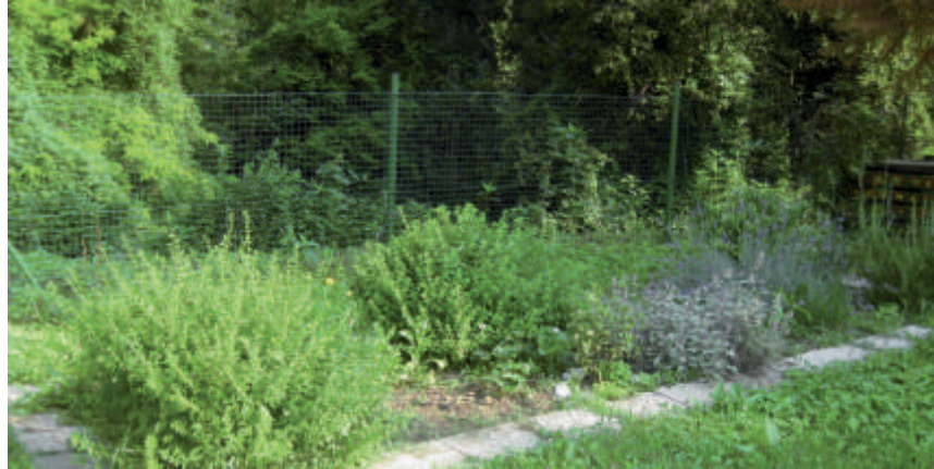
Zeliščni vrt pri kanalskem vrtcu

V delavnicah in na usposabljanjih bodo udeleženci pridobili široko znanje o zeliščih, ki ga bodo praktično uporabljali pri delu na zeliščnem vrtu. V okviru projekta bodo oblikovali tudi bazo podatkov o zeliščih, programe in priročnike za usposabljanje udeležencev v projektu. Obenem bodo razvili vsaj en produkt, ki bo zanimiv za trženje (prodajo).