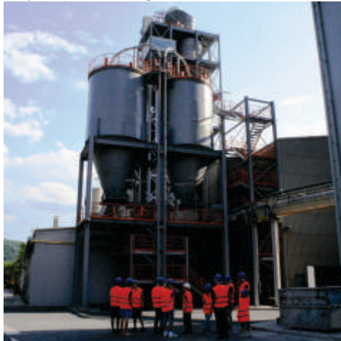
Dan odprtih vrat maja 2011: Obiskovalce Salonita najbolj pritegne ogled izmenjevalnika toplote.

prekinitev prodaje cementa nekaterim največjim dolžnikom in upad naročil kupcev, ki so se znašli v insolventnih postopkih. Slovenska potrošnja cementa je bila lani najnižja v zadnjih trinajstih letih. To se odraža tudi na poslovnih rezultatih Salonita, ki so za tretjino manjši od leta 2009: lani so prodali 553.000 ton cementa (rekord je bil leta 2008 s skoraj milijon tonami), izvozili 42.000 ton klinkerja, ustvarili 40 milijonov evrov prihodkov, konec leta pa na računu obdržali 11,6 milijona evrov bilančnega dobička.