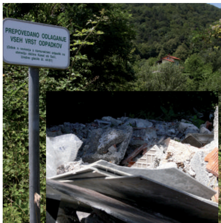
Azbest-cementni odpadki so junija 2011 končali v potoku pri Močilih. Dogodek preiskuje medobčinska inšpekcija. Po zakonu je za ravnanje z gradbenimi odpadki odgovoren investitor.