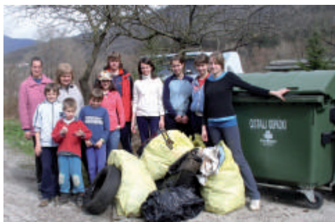
Prostovoljci na delu

Zavedamo se, da z eno akcijo na leto ne moremo očistiti vseh odpadkov v naši občini, je pa lahko takšna akcija dodatna priložnost za dvig zavedanja o pomenu čistega okolja in sprotnega ločevanja odpadkov.