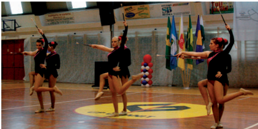
Naše barve je z 28 nastopi zastopalo 44 deklet

V drugi polovici avgusta pa tudi letos organiziramo štiridnevne intenzivne priprave za svoje članice v domu CŠOD v Tolminu.